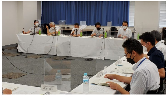
令和4年度第2回中部地方整備局ダム事業費等管理委員会の様子