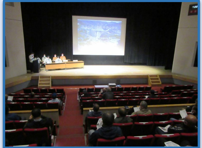
令和3年度八百津町住民説明会の様子