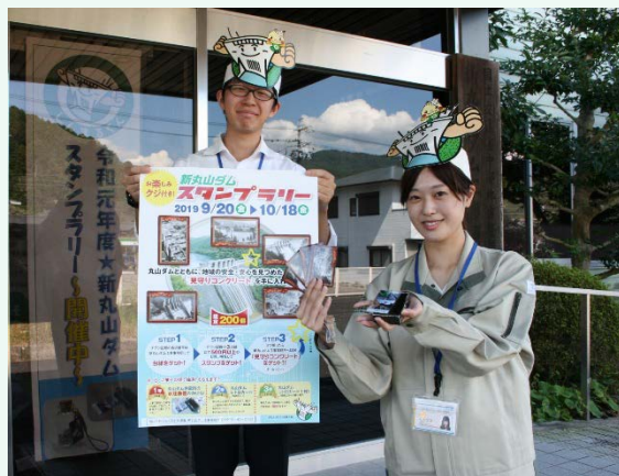
抽選で当たる水圧鉄管のかけらと丸山ダムレトロカード