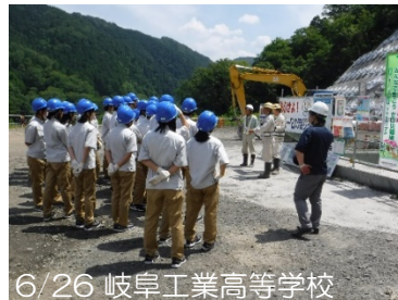
6/26 岐阜工業高等学校