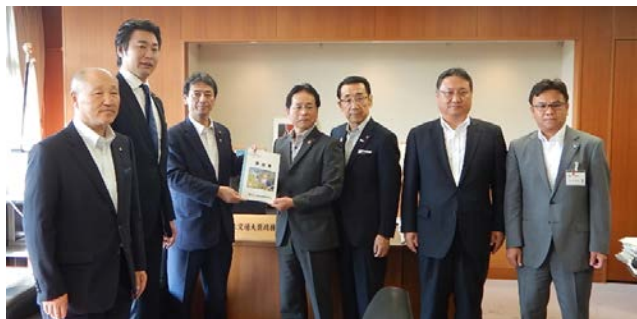
国土交通大臣政務官への要望

また、当日は財務省主計局への要望活動を行い、安全で安心できる国土を保全するため、地方が必要とする治水事業を着実に推進できるよう、国において必要予算の確保するよう要望が行われました。