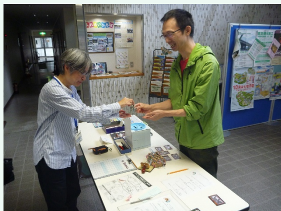
見守りコンクリート受け取りの様子

500円以上のお買い物でスタンプ1個もらえます。(1店舗1個限り) スタンプ用紙は各店舗または新丸山ダム工事事務所、丸山ダム管理所、八百津町・御嵩町役場で入手できます。 スタンプラリー参加店舗は新丸山ダム工事事務所ホームページ内の「新着情報」よりご確認ください。 http://www.cbr.mlit.go.jp/shinmaru/index.html