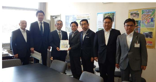
水管理・国土保全局長への要望