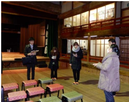
美濃歌舞伎博物館相生座