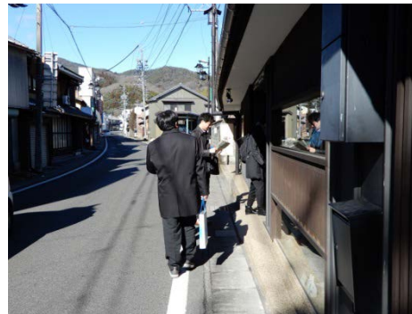
八百津町古い町並み散策