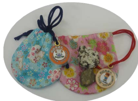
転流工記念石「初回発破石」