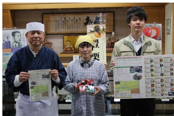
やおつうまいもの会会員と事務所職員