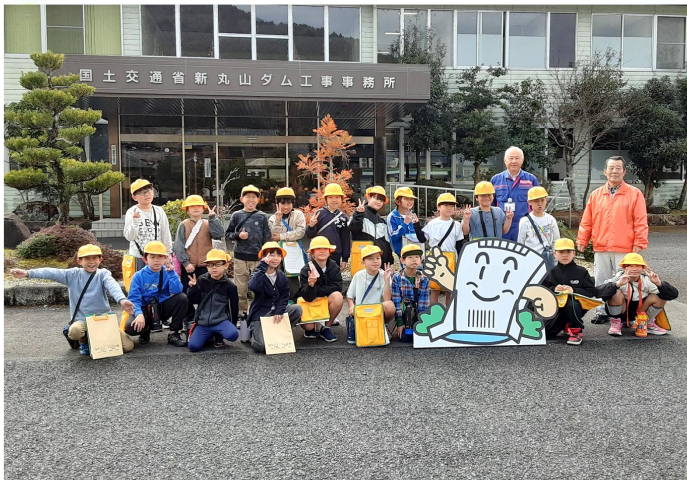
▲ 2/26(木) 八百津小学校3年生現場見学