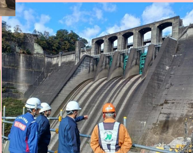
↑安全パトロールの様子

工事及び業務の発注者・ 受注者約80名が参加し、 労働基準監督署 (恵那、関、多治見) より 講話を頂いたほか、 各現場での安全対策優良事例 の発表を行いました。