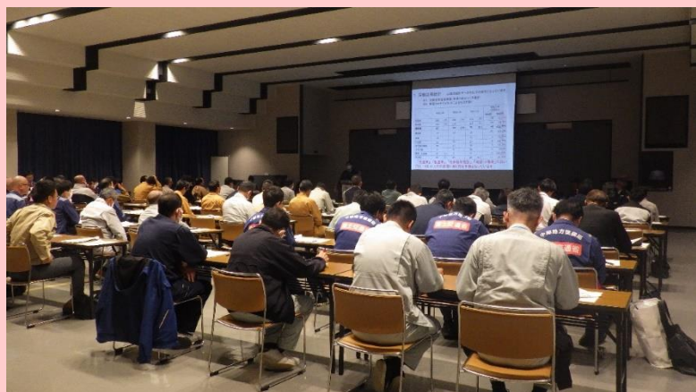
↑安全協議会 総会の様子

工事等の現場作業に伴う、労働災害の防止、 第三者に対する安全対策等を目的に事業等安全協議会総会 を開催しました。