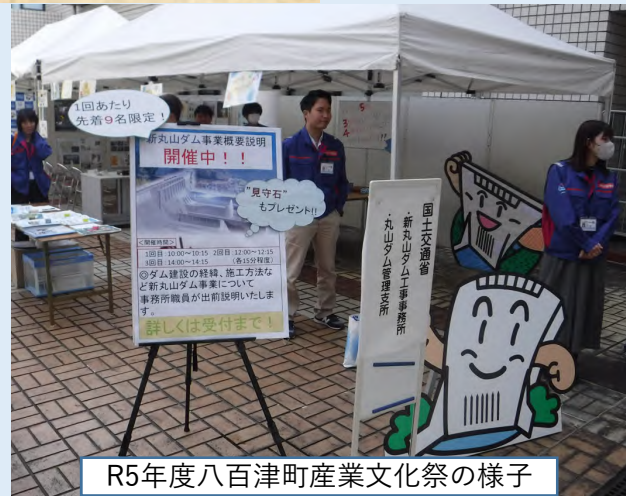
R5年度八百津町産業文化祭の様子

A.「現場見学の案内」「SNSによる情報発信」「八百津町産業文化祭での事業PR」「『みずしるべ』などの広報誌作成」などを行っています。