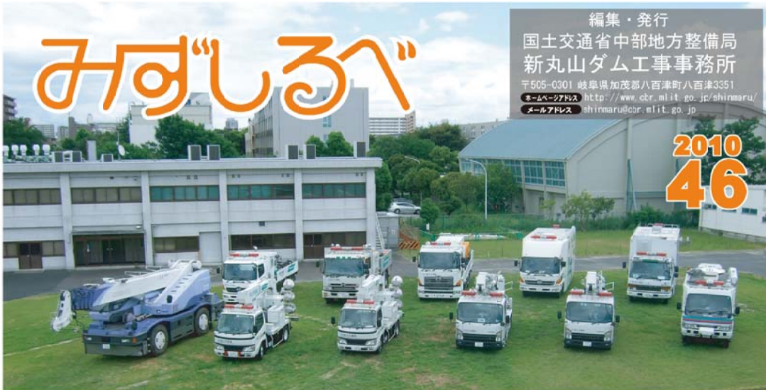
中部地方整備局の「資機材管理センター(中部技術事務所)」に揃う災害対策車両