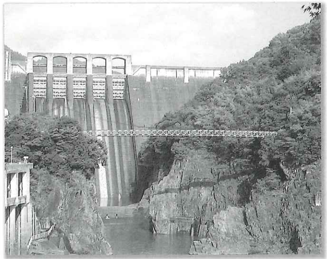
現在の小和沢橋と丸山ダム

他の橋梁形式と比べて、経済的で工事期間も短いのが特徴です。比較的新しい橋梁形式のため、車が通れる橋への適用事例は、日本ではわずかしかありません。