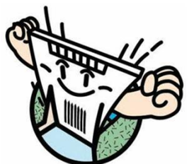
新丸山ダムのキャラクター しんまるくん