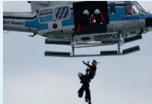
ヘリによる海上漂流者救助訓練