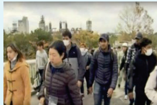
外国人留学生も参加した避難訓練