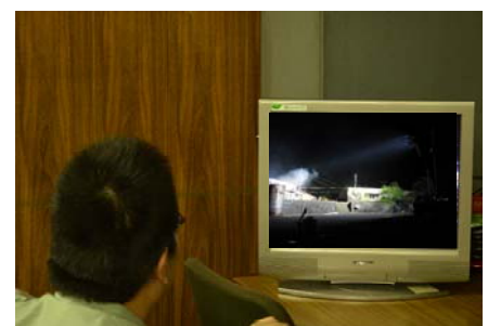
土岐市役所内モニター