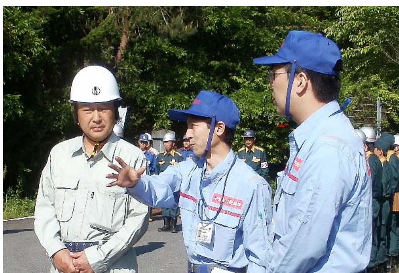
土岐市長(左)に照明車とKu-SATの説明をする中部地方整備局職員

朝一番に現地入りした土岐市長からは、 「中部地方整備局の支援には大変感謝している」 旨の御礼の言葉も頂きました。