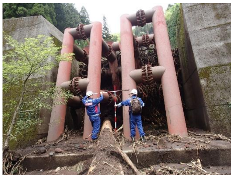
砂防施設の被害状況の調査