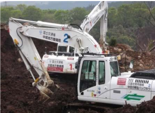
無人化施工バックホウによる道路啓開