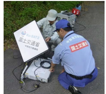
小型衛星画像伝送装置の準備状況