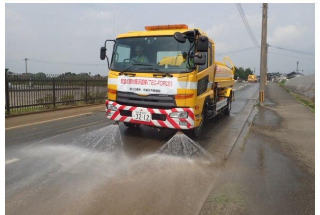
散水作業（応急対策班）