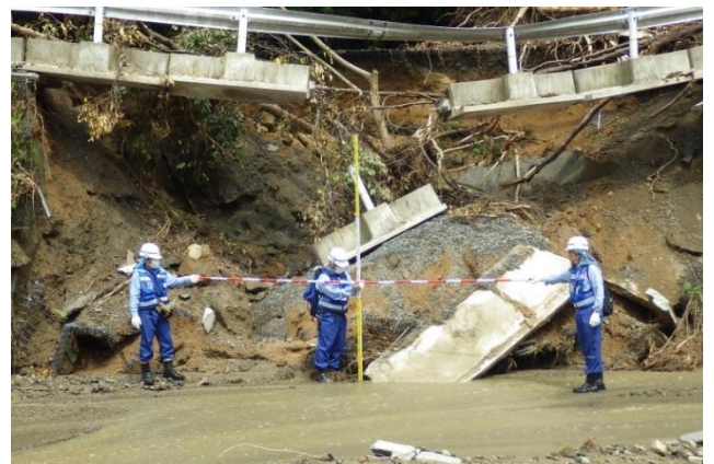
被災状況調査（河川調査班）