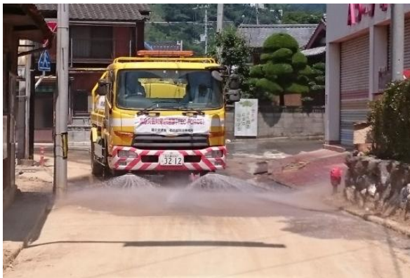
散水車による路面清掃作業