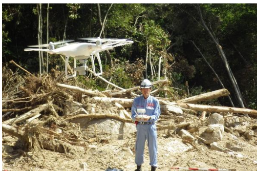
ドローン(無人航空機)を使った調査