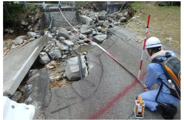
道路施設の被災状況調査