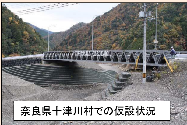
奈良県十津川村での仮設状況

橋や道が流され、緊急に交通路を確保する必要がある場合に、組立式の橋を短期間で架設できます。20t~25tの車両が通行できます。