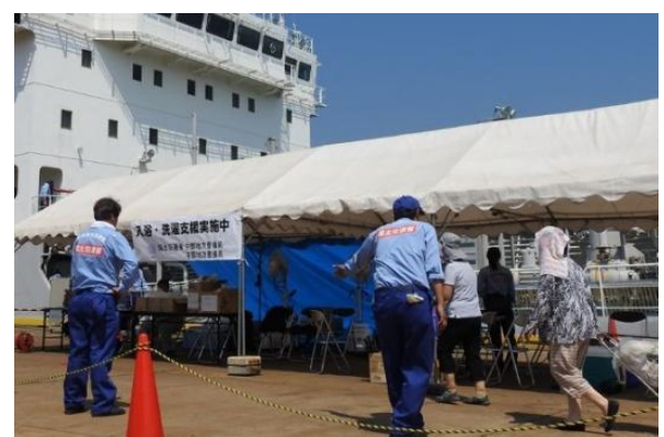
清龍丸による支援