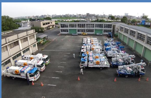
災害対策用機械の派遣(又は貸与)