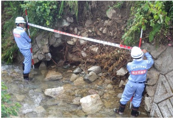
河川施設の被災状況調査

平成30年7月、梅雨前線が本州付近停滞し、暖かく湿った空気が流れ込んだため、広い範囲で記録的な大雨となった。中部地方整備局TEC—FORCEは、岐阜県、愛媛県、岡山県、広島県において、河川・道路等の被災状況調査、ドローンを用いた樹木・土砂堆積調査、散水車による道路清掃や生活用水の給水支援、大型浚渫兼油回収船「清流丸」による支援物資の輸送や被災者への入浴支援等、様々な分野で活動しました。