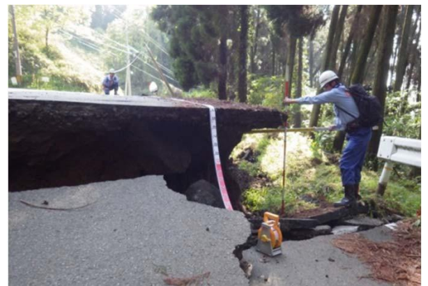
被災状況調査（道路調査班）