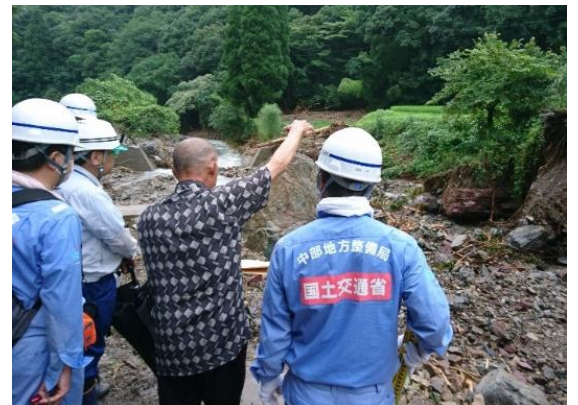
地元の方から被災状況の聞き取り調査