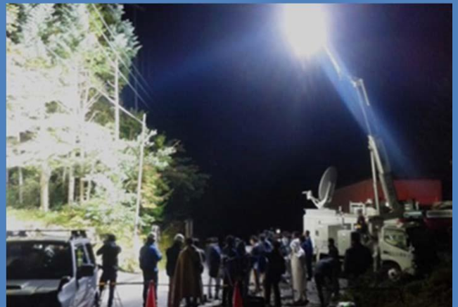
救助活動を支援する照明車