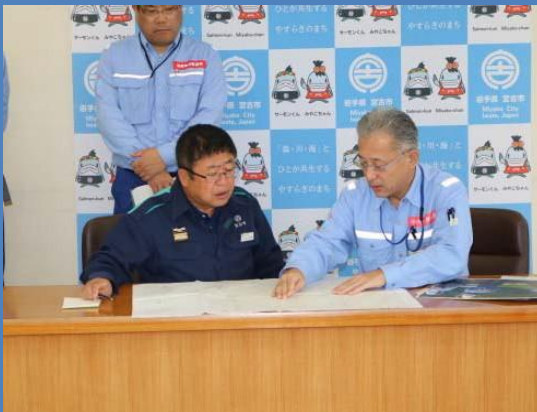
首長へ被災状況調査結果を報告