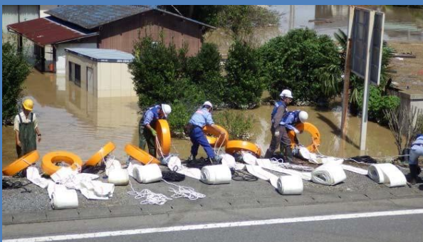
浸水を早期に解消するため24時間体制で排水作業を実施