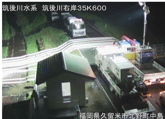
筑後川水系 筑後川右岸35K600