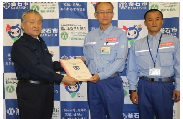
岩手県釜石市長との手交式