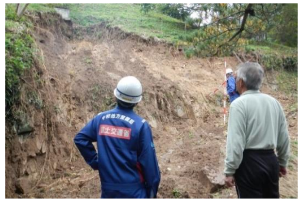
地元の方から被災状況の聞き取り調査