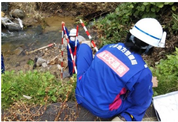
河川施設の被災状況調査

令和元年10月、台風第19号の影響により、関東・東北地方で甚大な人的・物的被害が発生。中部地方整備局TEC-FORCEは、神奈川県、埼玉県、茨城県、岩手県、宮城県、福島県において、河川・道路・土砂災害等の被災状況調査、排水ポンプ車による排水作業を実施し、早期の浸水解消に努めました。