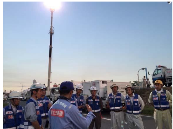
排水活動の指揮をする隊員