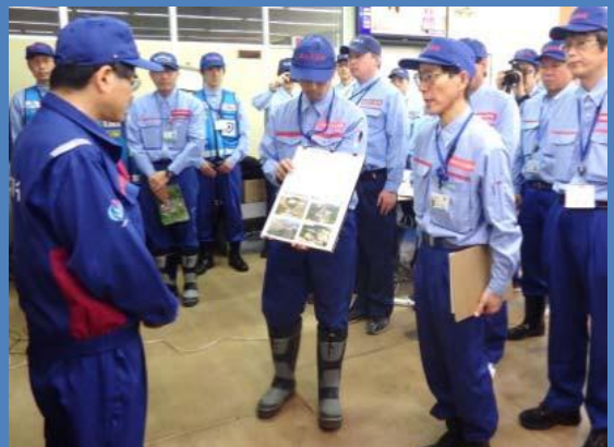
国土交通大臣へ被災状況を説明