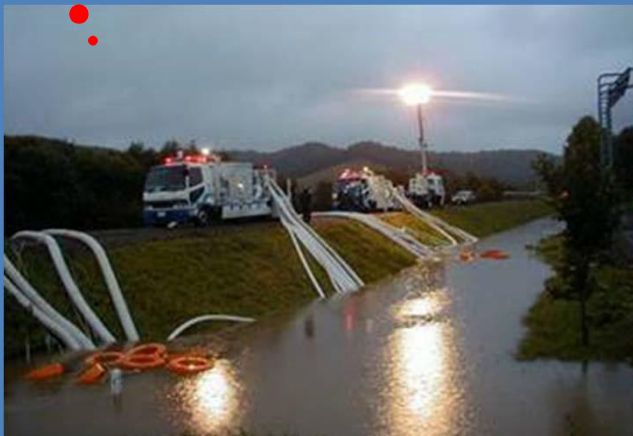
夜間排水作業を照らす照明車