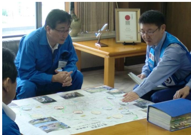
市長への被災状況調査の中間報告