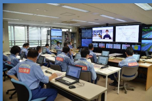
リエゾンの報告をもとに支援方を判断