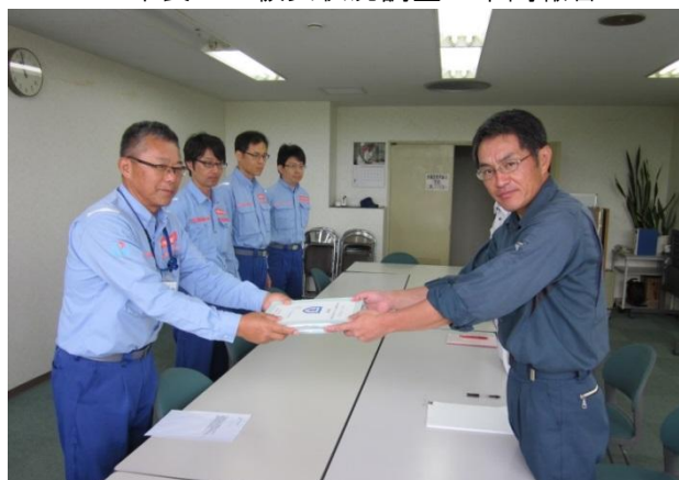
町役場にて調査報告書提出