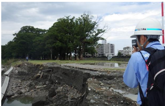
河川施設の被害状況の調査