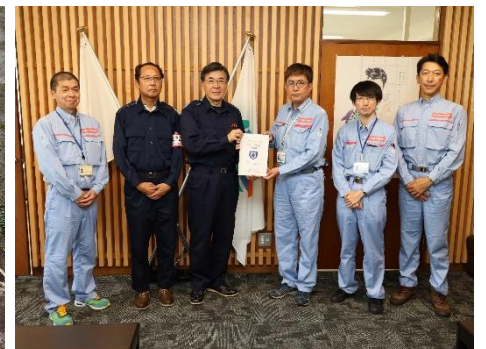
調査結果の自治体への報告