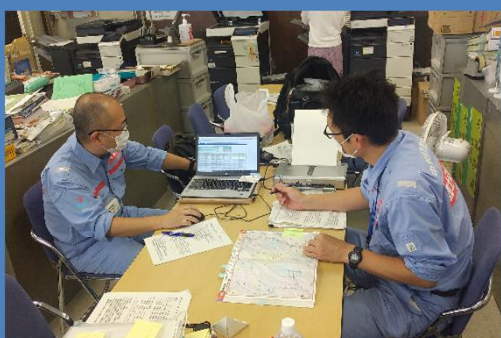
自治体の被害情報や支援ニーズを把握