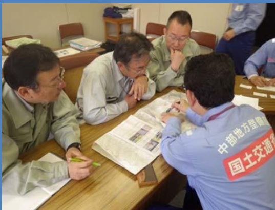
復旧工事業者への技術的助言を実施