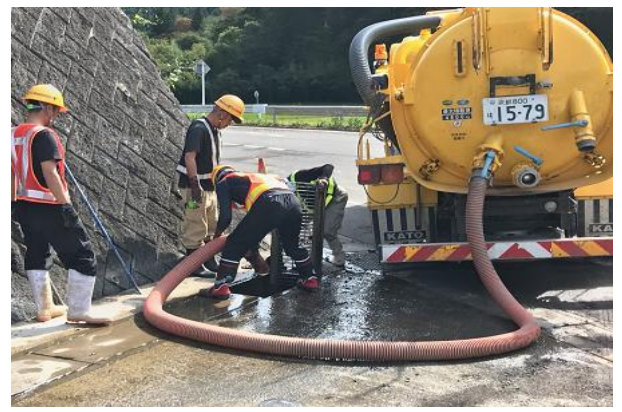
排水管清掃車による堆積土砂の吸い上げ作業