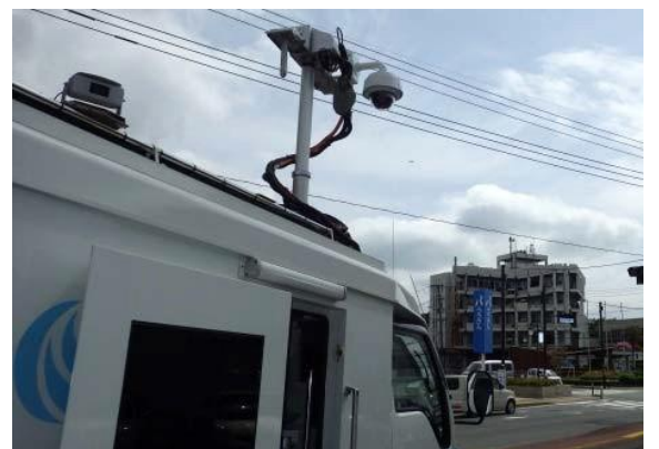
衛星通信車により市役所の被災状況を監視