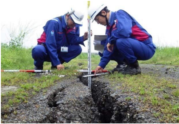
被災状況調査（道路調査班）

平成28年4月に2回の震度7を記録した熊本地震では、中部地方整備局TEC—FORCEが九州地方整備局管内で、河川・道路・砂防等の被災状況調査・中部地方整備局所有の船舶にて支援物資の提供及び入浴支援・災害対策機械による道路啓開及び映像共有・建築物危険度判定調査・リエゾンによる支援に必要な情報収集等様々な分野で活動しました。