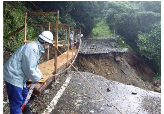
道路崩壊箇所の被災状況調査