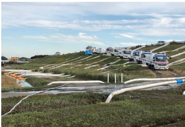
排水ポンプ車による排水作業