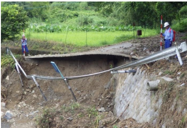
被災状況調査（道路調査班）

平成29年7月、九州北部の福岡県から大分県にかけて強い雨域がかり、短時間に記録的な雨量を観測。中部地方整備局TEC—FORCEが河川・道路・砂防等の被災状況調査や、散水車、による応急対策等、様々な分野で活動しました。