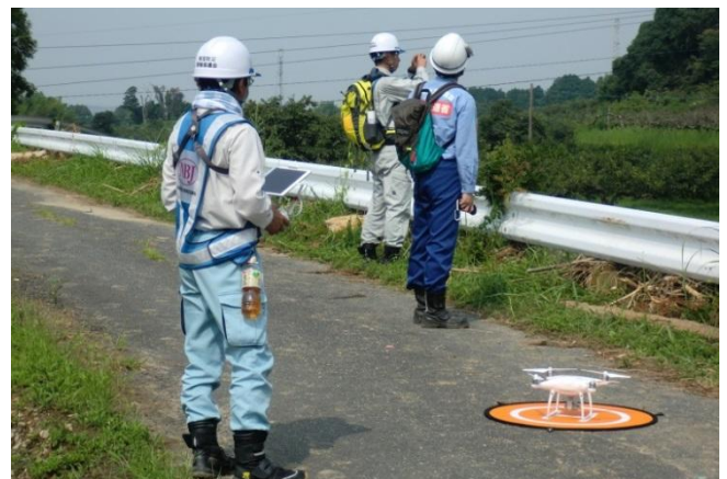
ドローンを飛ばして被災状況調査（砂防調査班）