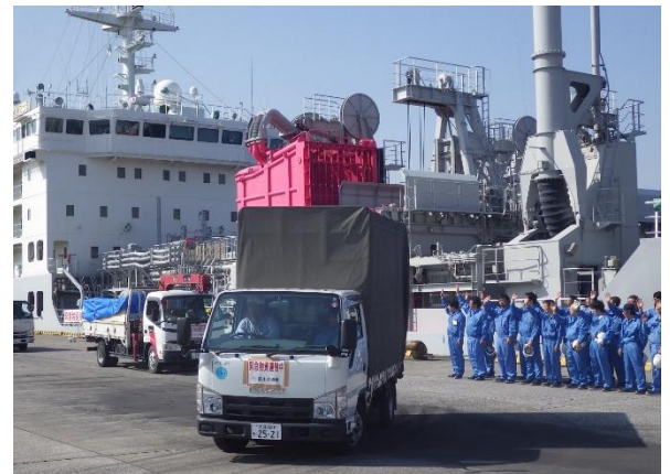
清瀧丸による支援物資の提供