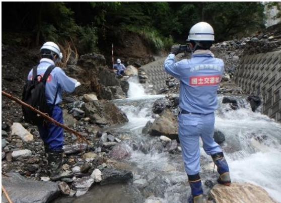
砂防施設の被災状況調査

令和2年7月、梅雨前線の影響により九州地方では記録的な大雨となり、甚大な被害が発生。また、岐阜県、長野県でも大雨となり、県内の市町村で大雨特別警報が発表。中部地方整備局TEC—FORCEは、福岡県、熊本県、岐阜県、長野県において、河川、道路の被災状況調査、排水ポンプ車による排水作業を実施するなど、早期復旧に向けた支援を行いました。