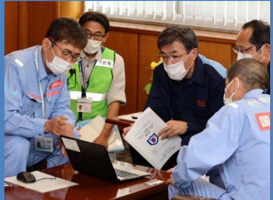
首長へ調査結果を報告