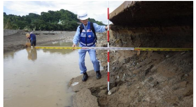
管理施設の被害状況の調査