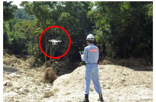
ドローンを用いた被災調査