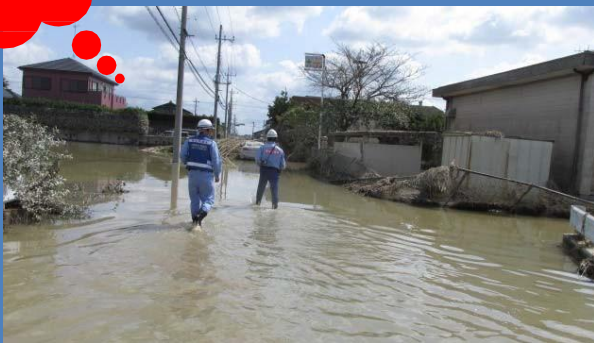
現地調査をもとに排水ポンプ設置位置を選定