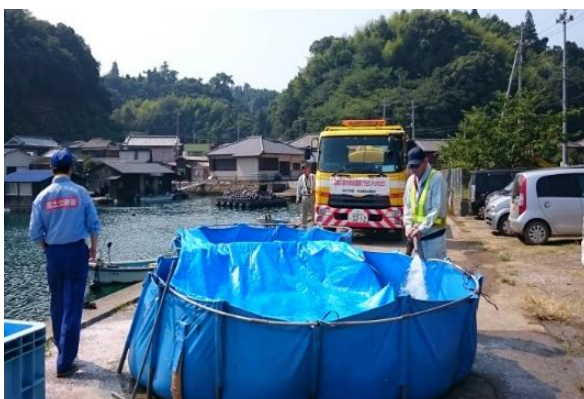
散水車による生活用水の給水作業