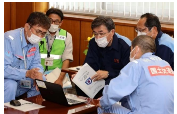
ドローン映像を見ながら下呂市長へ報告