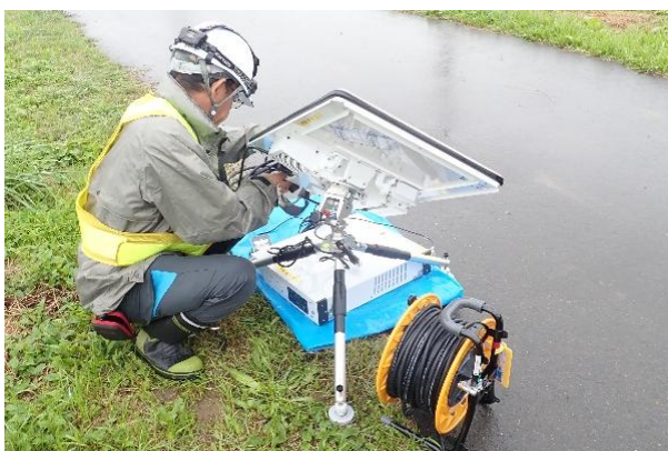
Ku-SAT II（小型画像伝送装置）の設置状況