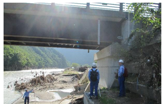
橋梁の被災状況の確認