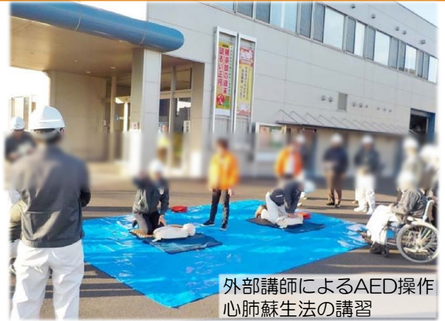
外部講師によるAED操作 心肺蘇生法の講習