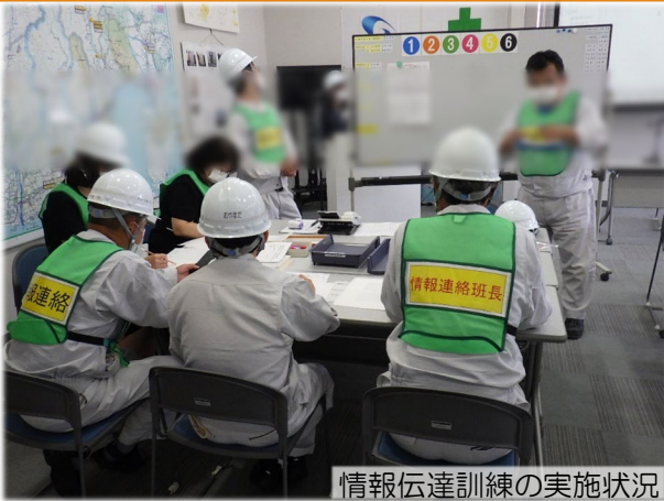
情報伝達訓練の実施状況