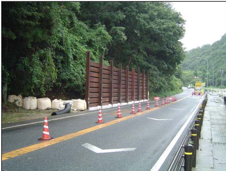
仮設防護柵設置状況