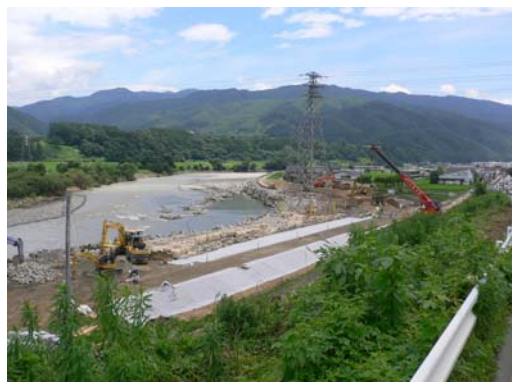
⑦7/27 12時 進入路を除き築堤盛土完了 大型連節ブロック張着手