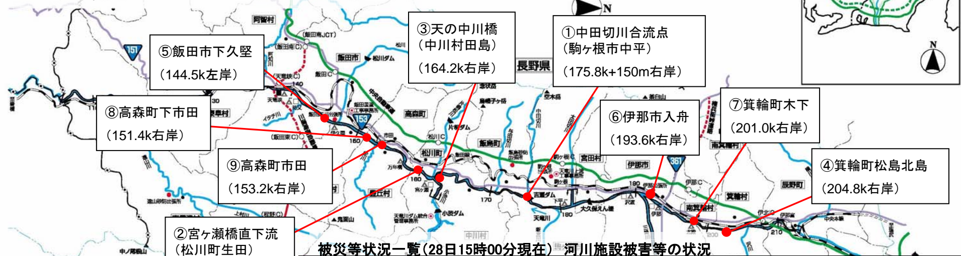
被災等状況一覧(28日15時00分現在) 河川施設被害等の状況