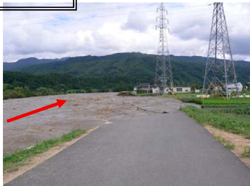
①7/19 堤防決壊直後(上流側から)