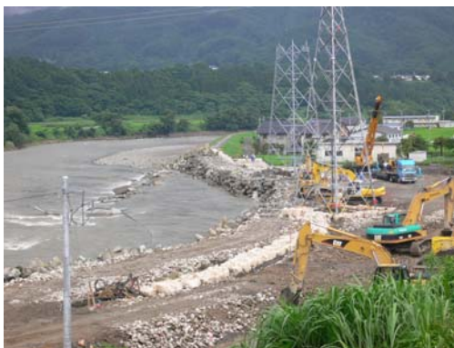
⑤7/24 15時 緊急復旧工事の根固ブロック投入完了