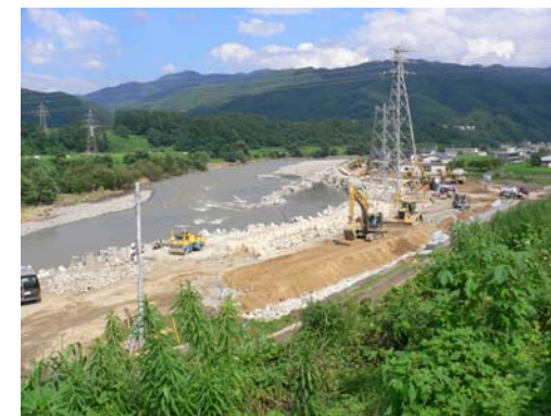
⑥7/26 15時 築堤盛土施工中