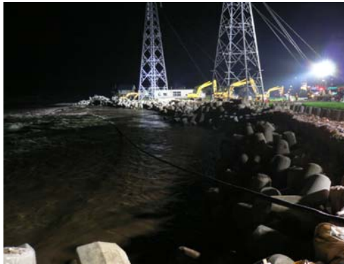
②7/21 19時30分 応急復旧工事了