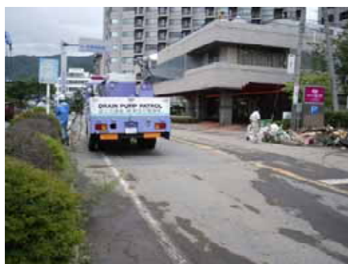
7/20 夕方(諏訪市湖岸通り2丁目付近)