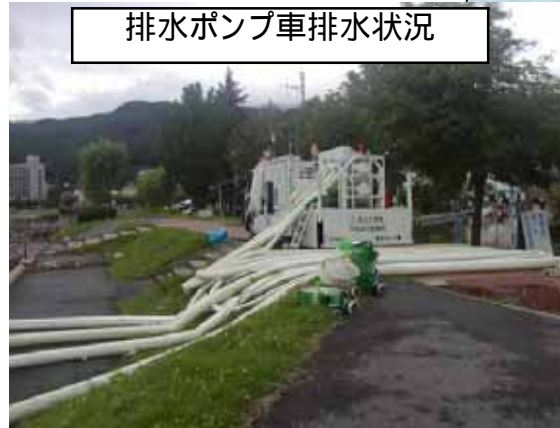
排水ポンプ車排水状況