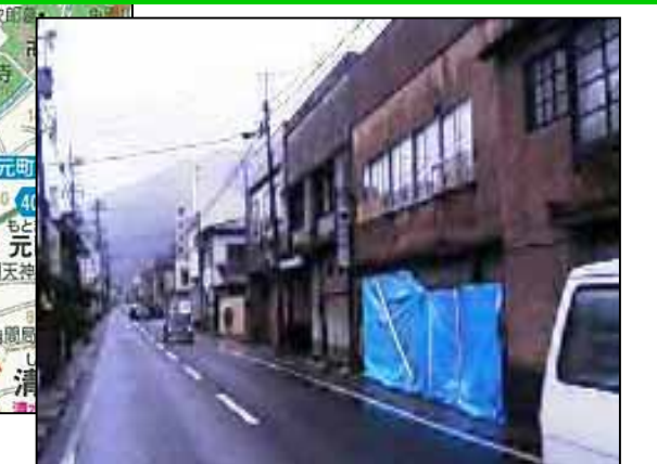
【7/21未明の状況写真】 (諏訪市湯の脇2丁目付近)