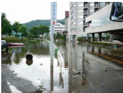
7/20 昼頃の冠水状況(諏訪市湖岸通り2丁目付近)

なお、残りの排水ポンプ車(関東地方整備局13m 3 /min1台、中部地方整備局40m 3 /min1台)のうち40m 3 /minのポンプ車については7月21日午前中に湖南地区の排水作業を実施しました。(関東地方整備局派遣の13m 3 /minポンプ車については湖岸地区にて待機中です)