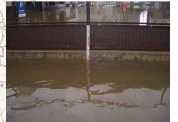
【道路冠水状況写真】 (7/20 昼頃:諏訪市湯の脇2丁目付近)