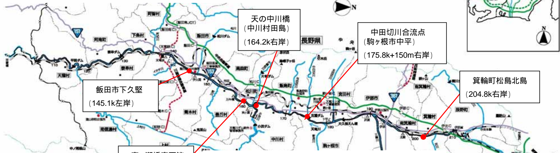
被災等状況一覧(21日12時00分現在) 河川施設被害等の状況