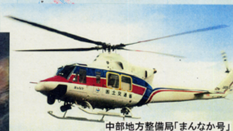
中部地方整備局「まんなか号」

台風21号通過後の防災対策ヘリコプター(まんなか号)による調査及び被災状況現地調査の実施