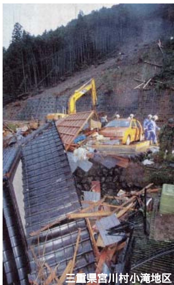
三重県宮川村小滝地区