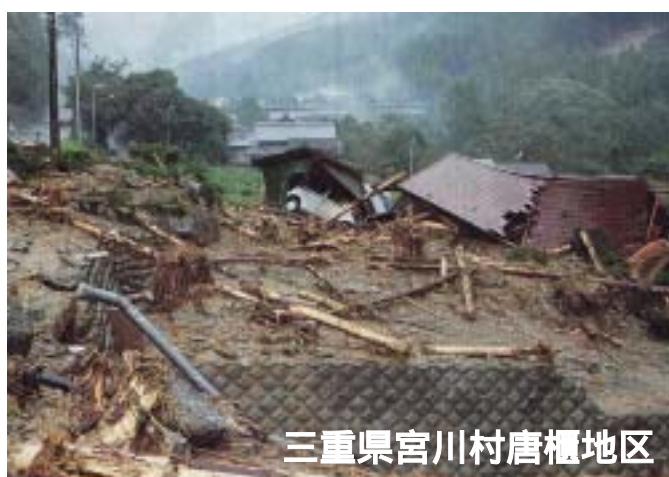
三重県宮川村唐櫃地区