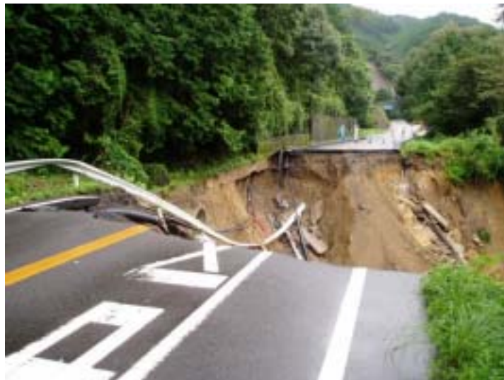
一般国道 4 2 号北牟婁郡海山町便ノ山における道路決壊