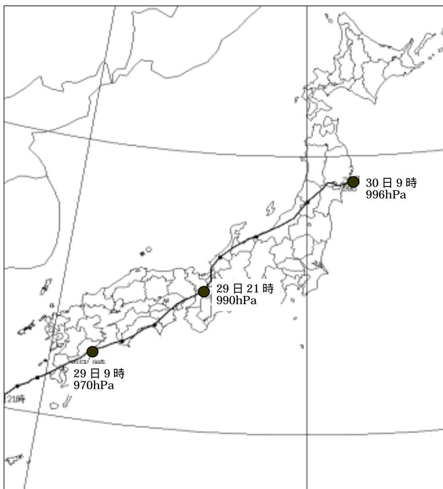
台風第21号の経路図（位置は3時間毎）