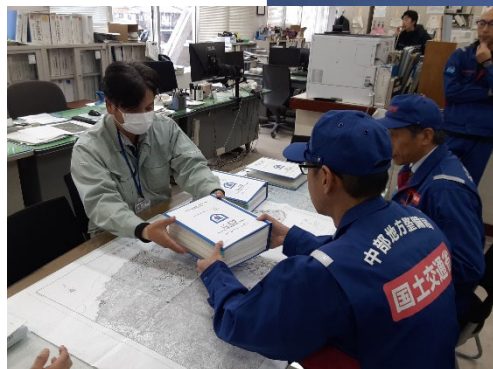
被災状況調査班:道路班 珠洲市役所にて調査報告会

期間：1月8日(月)～第4陣派遣中 職員：実人数2人(延べ56人・日) 班構成：本局 活動内容：石川県庁にて打合せ 七尾市役所にて内業 七尾市内にて被災状況調査