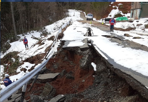
被災状況調査班:道路班 能登町内にて現地調査

期間：1月2日(火)～第6陣派遣中 職員：実人数20人(延べ648人・日) 班構成：道路部③、愛国③、名四④、浜松②、高山① 活動内容：珠洲市役所にて調査報告会 能登町内にて被害状況調査