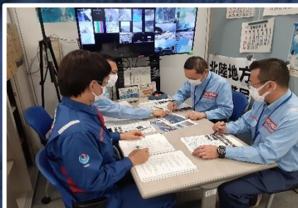
情報通信班(北陸情通支援) 北陸地方整備局

期間：1月6日（土）～ 第4陣 派遣 職員：実人数3人(延べ60人・日) 班構成：道路班 活動内容：市町が管理する道路 （生活道路）の被害状況を把握 内業