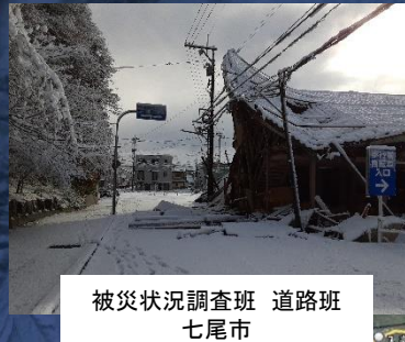
被災状況調査班 道路班 七尾市