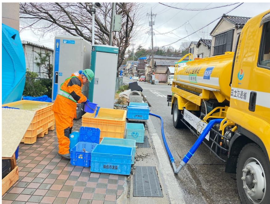
輪島市にて給水支援【応急対策班】

本日（3月1日）の現地のTEC-FORCE（緊急災害対策派遣隊）の主な活動は以下のとおりです。