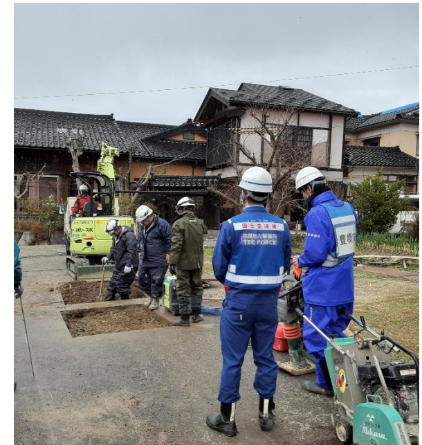
七尾市にて現地確認【上下水道支援班】