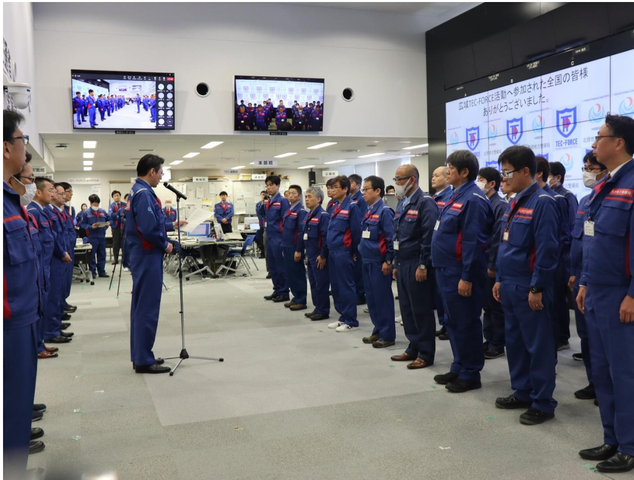
北陸地方整備局にて離任式【先遣班】