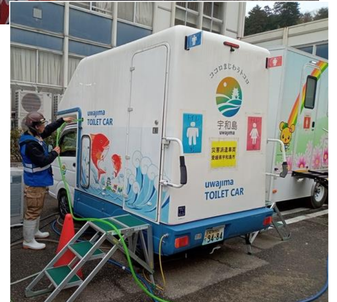
輪島市内にて給水支援【応急対策班】