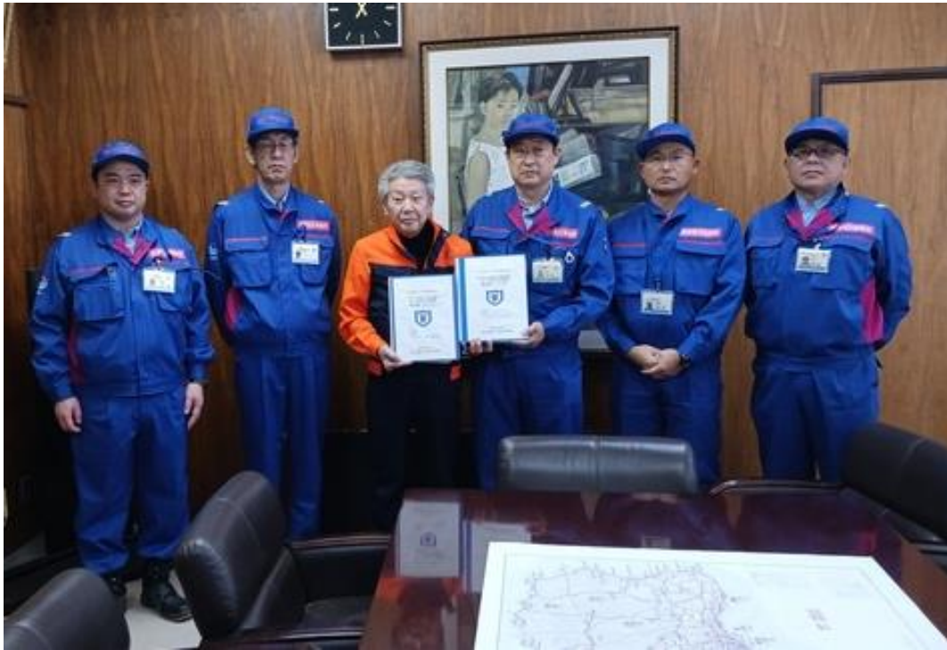
珠州市役所にて手交式【道路班】