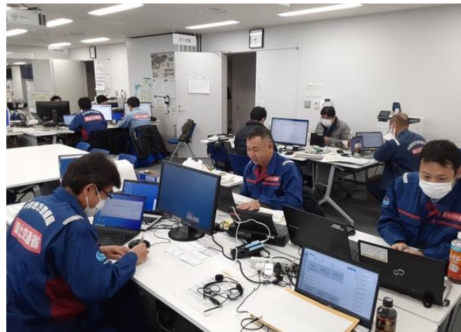
北陸地整にて内業【先遣班】