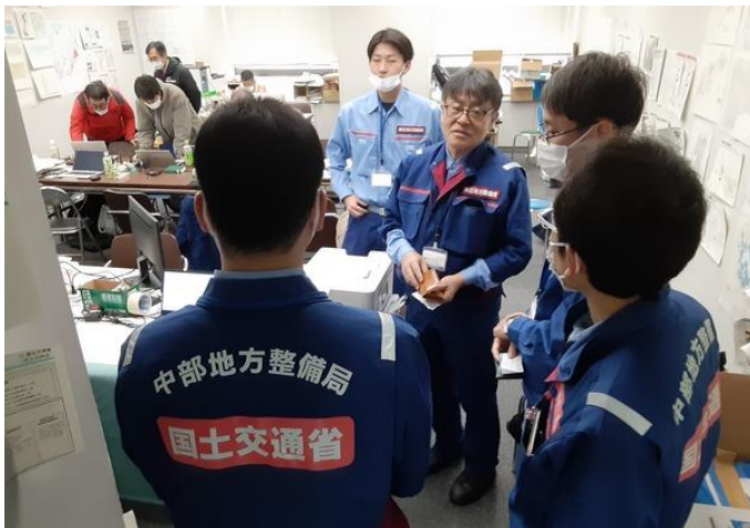
関係機関打ち合わせ【上下水道支援班】