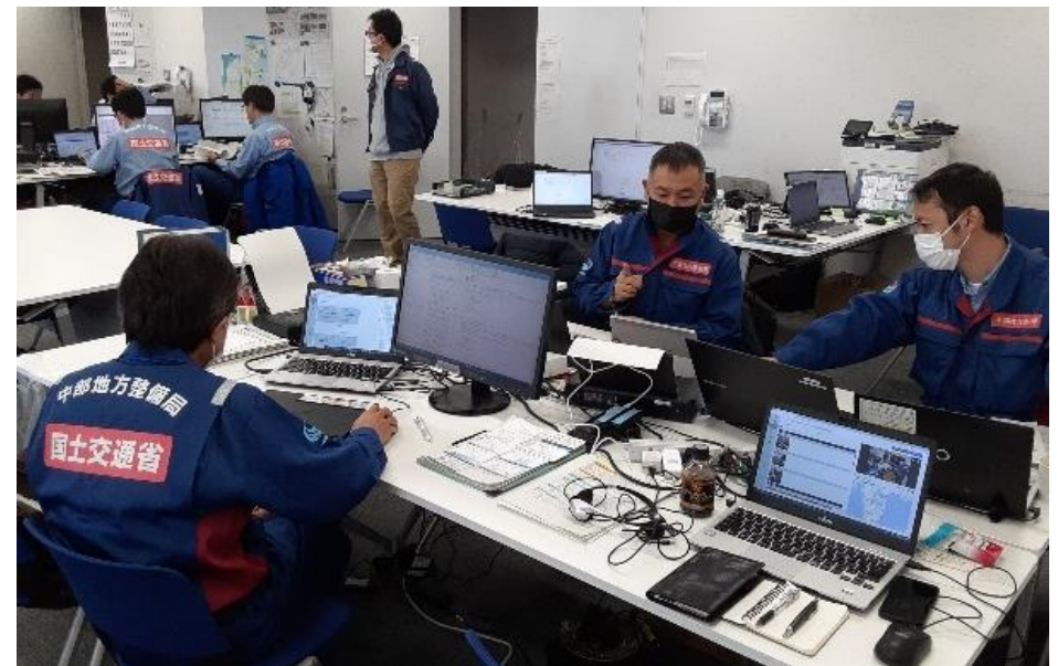
北陸地整にて内業【先遣班】