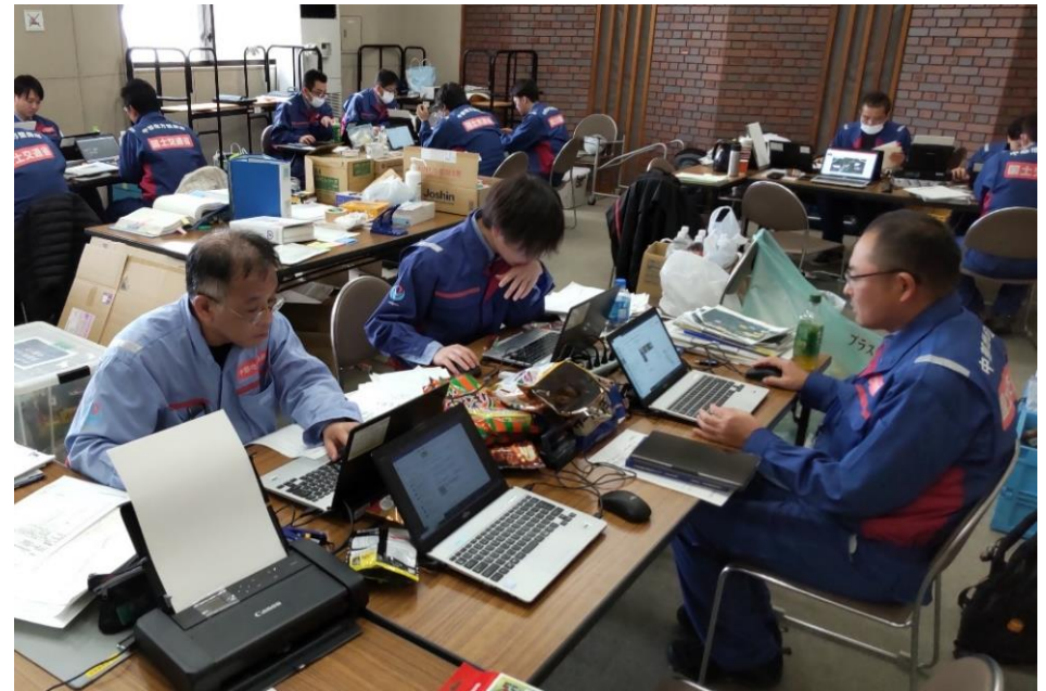
クロスランドおやべにて内業【道路班】