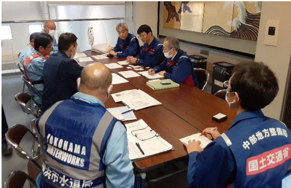
志賀町役場にて関係機関と打合せ【上下水道支援班】