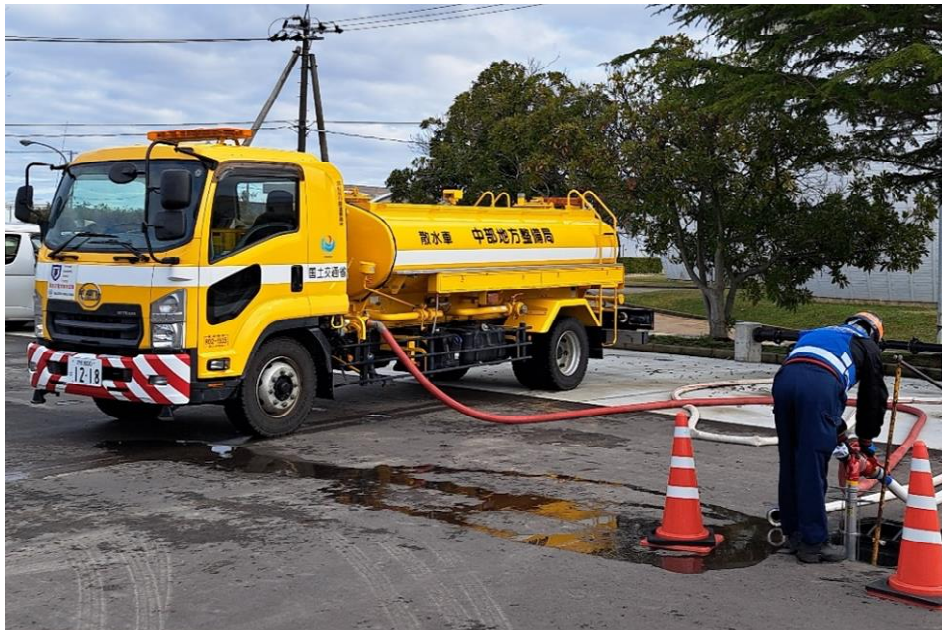
金沢市内にて補給【応急対策班】