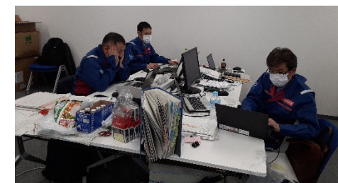
北陸地整にて内業 【先遣班】