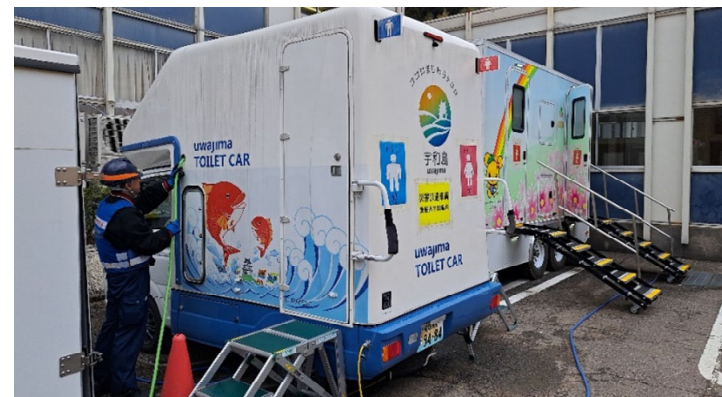
輪島市内にて補給【応急対策班】