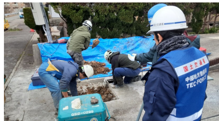
七尾市内にて現地確認【上下水道支援班】