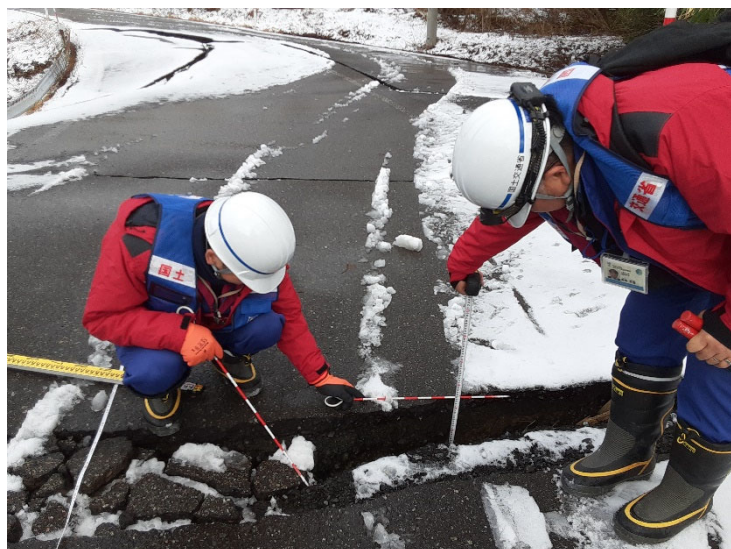
珠洲市内にて現地調査 【道路班】