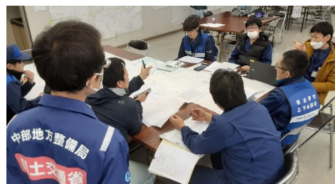
七尾市役所にて関係機関と打合せ 【上下水道支援班】