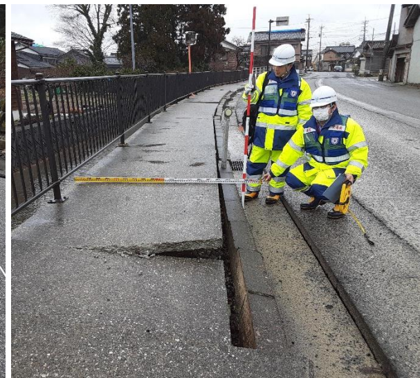
珠洲市内にて現地調査【道路班】