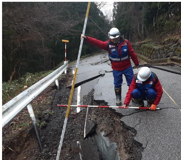
珠洲市内にて現地調査【道路班】