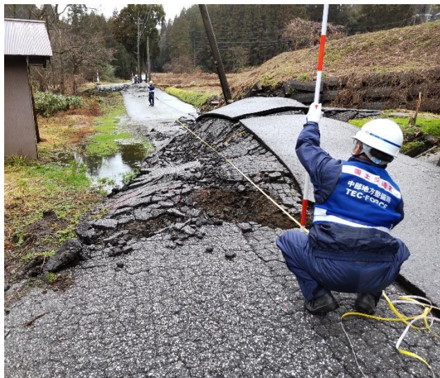
珠洲市内にて現地調査【道路班】