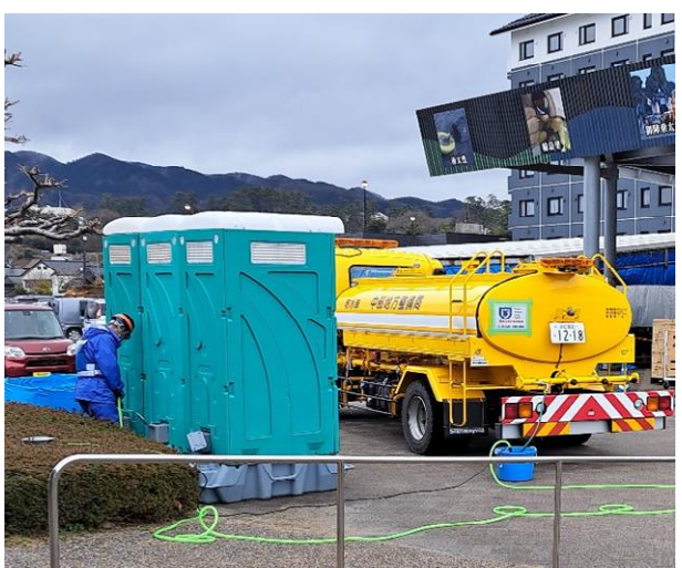
輪島市内にて給水支援【応急対策班】