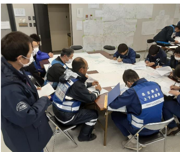
七尾市内にて打ち合わせ【上下水道支援班】