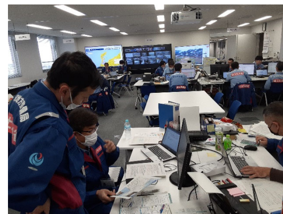
北陸地整にて内業【先遣班】