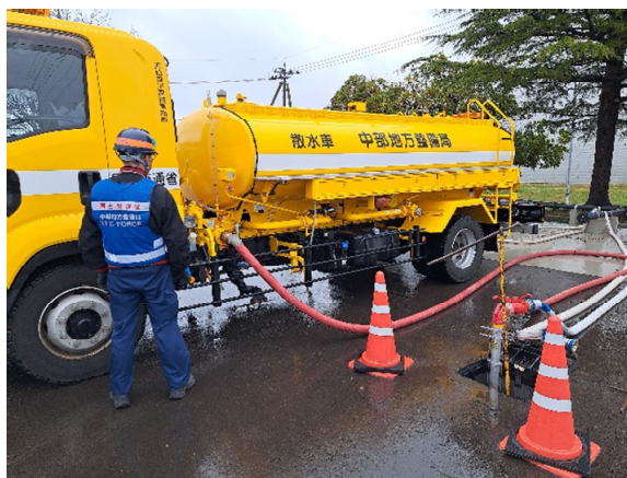
金沢市内にて補給【応急対策班】