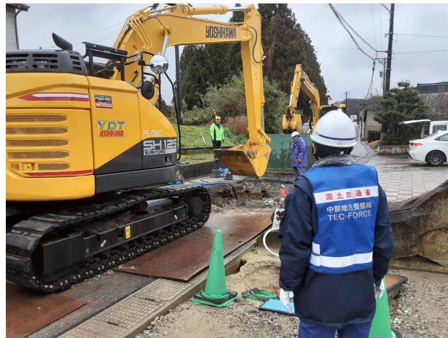
七尾市内にて現地確認【上下水道支援班】