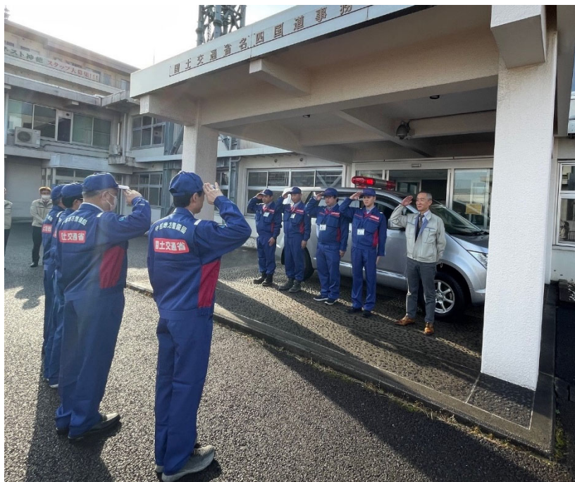
第9陣を派遣(出発式)【道路班】