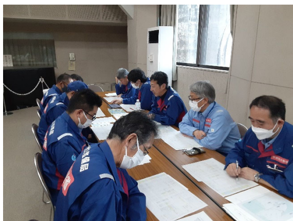
第8陣と第9陣との引継ぎ【道路班】