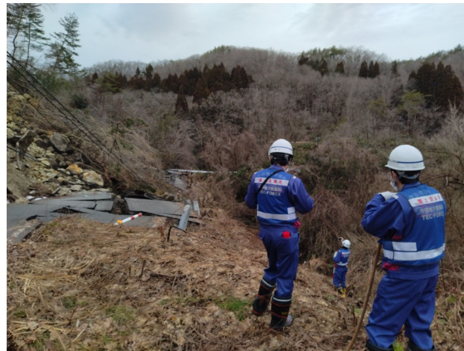
珠洲市内にて現地調査【道路班】