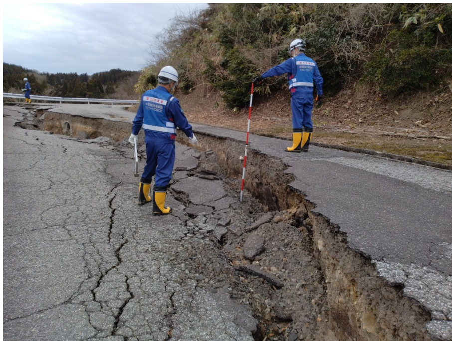
珠洲市内にて現地調査【道路班】