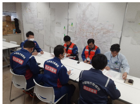
金沢市企業局にて打合せ【上下水道支援班】