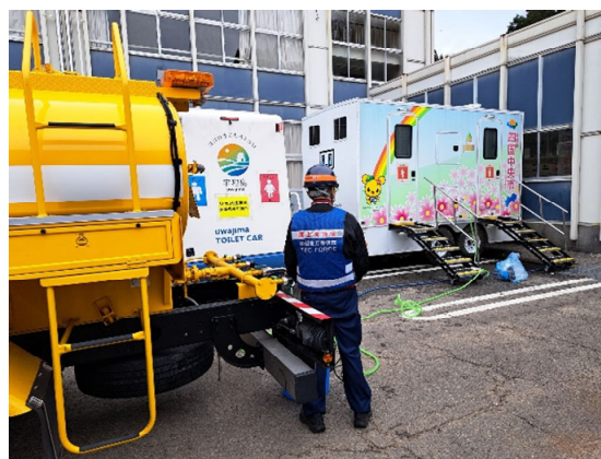
輪島市内にて給水支援【応急対策班】