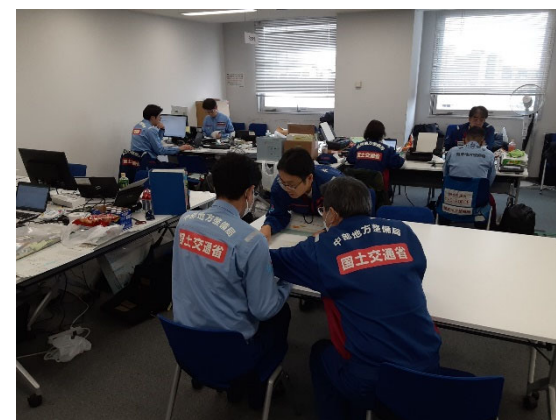
北陸地整にて内業【先遣班】