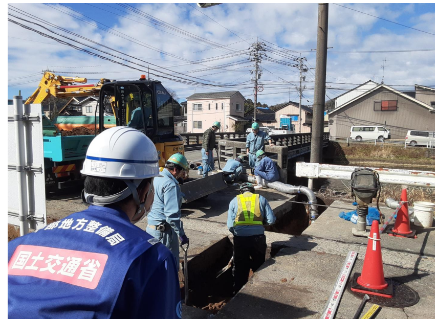
七尾市内にて現地調査【水道支援班】