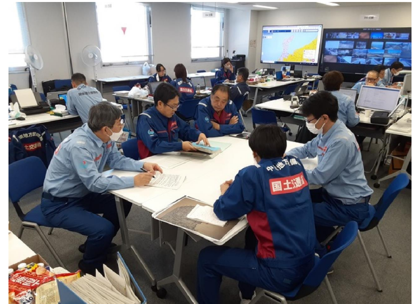
北陸地整にて内業【先遣班】