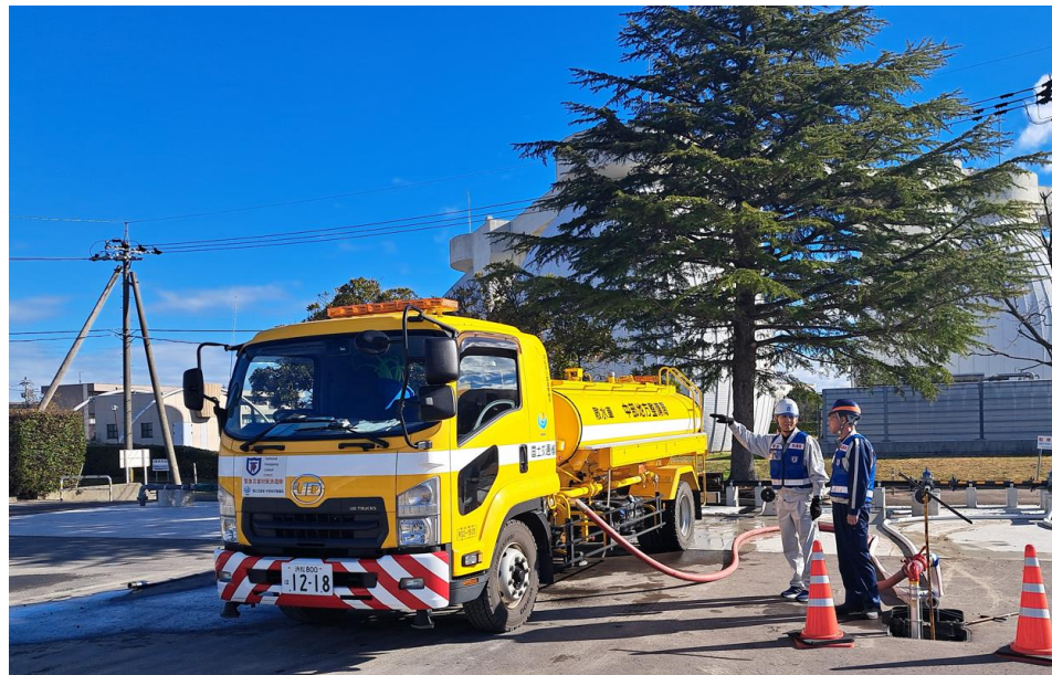
金沢市 城北水質センターにて水の補給【給水支援班】