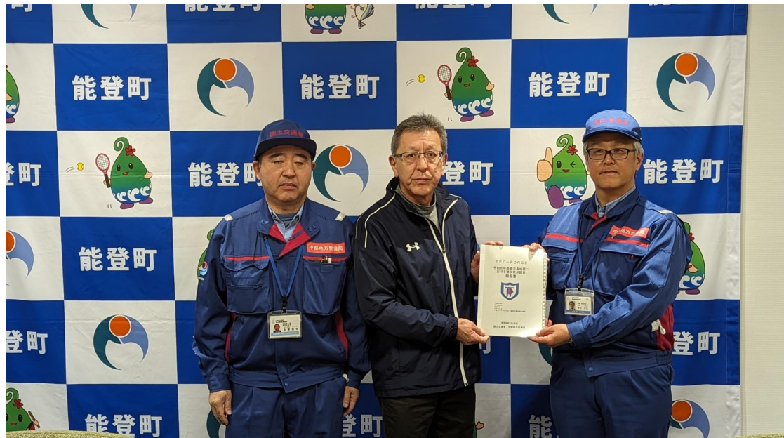
能登町長へ手交【道路班】