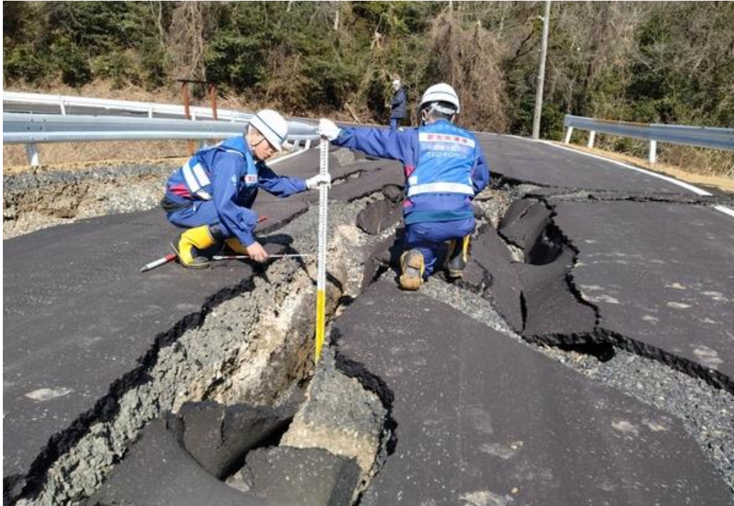
珠洲市内にて現地調査【道路班】