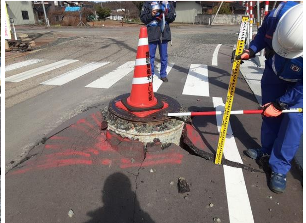
珠洲市内にて現地調査【道路班】