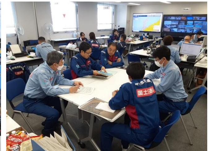
北陸地整にて内業【先遣班】