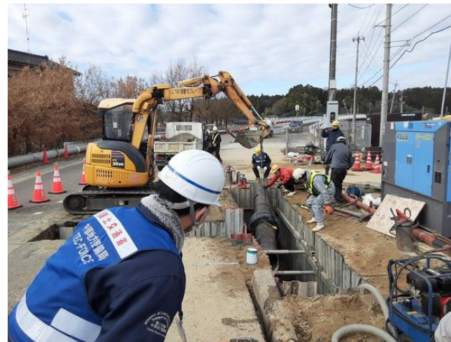
七尾市内にて現地調査【水道支援班】