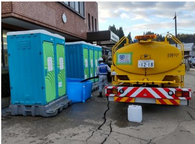
輪島市内にて給水支援【給水援班】