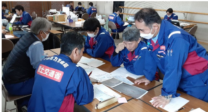
小矢部市内にて内業【道路班】