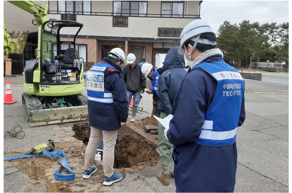
七尾市内にて現地調査【水道支援班】