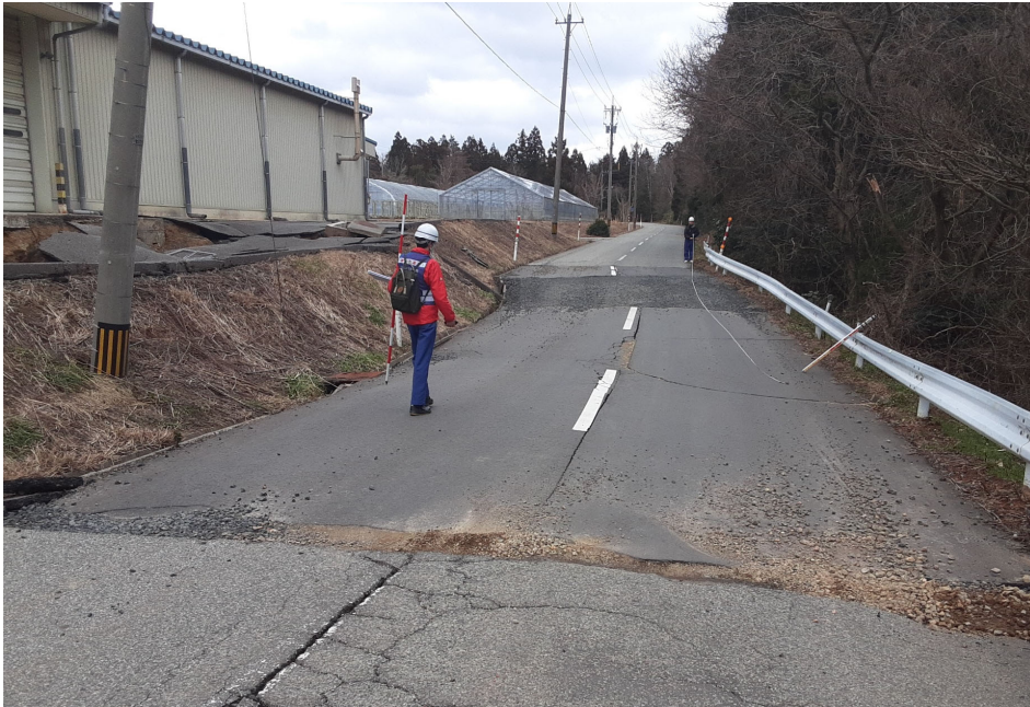
珠洲市内にて現地調査【道路班】