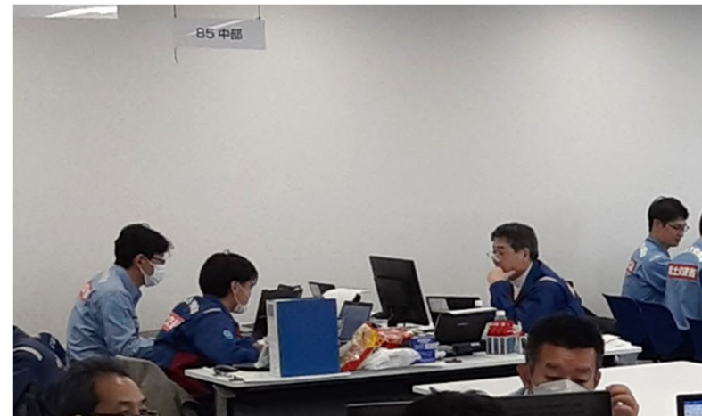
北陸地整にて内業【先遣班】