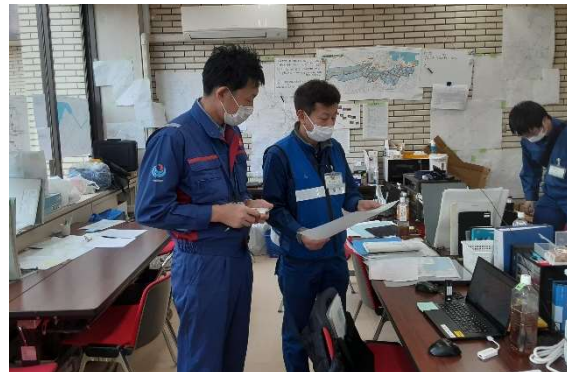
七尾市役所にて内業【水道支援班】