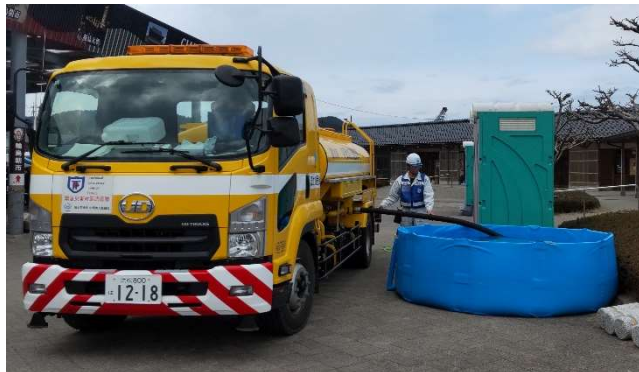
輪島市内にて給水支援【給水支援班】