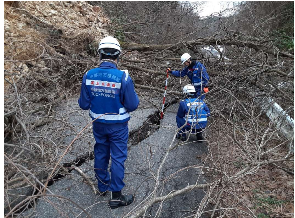
能登町内にて現地調査【道路班】