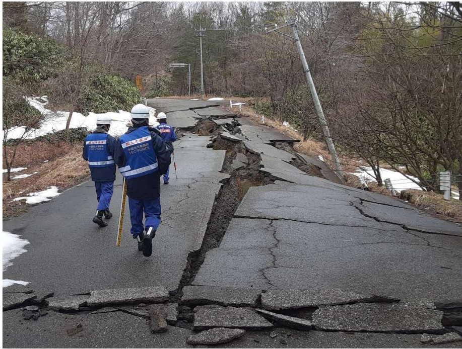
珠洲市内にて現地調査【道路班】