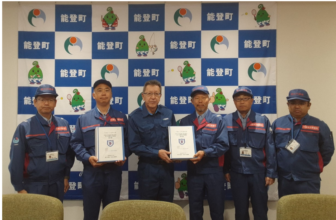
能登町にて手交式【道路班】