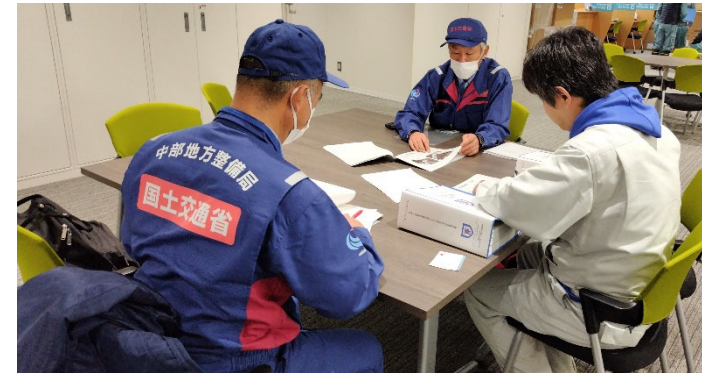
能登町役場への説明【道路班】