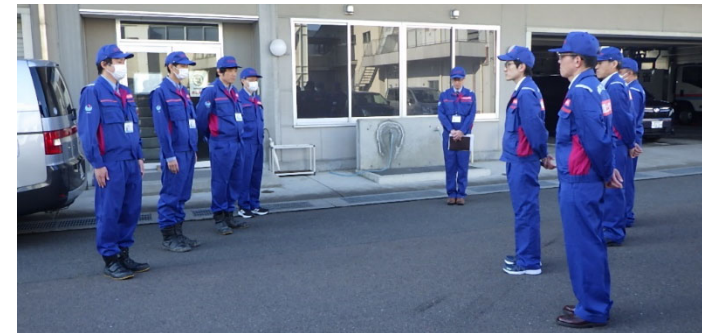
第8陣を派遣【道路班】