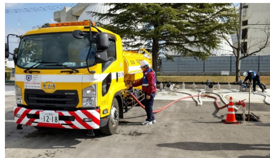
金沢市城北水質管理センターにて補給 【給水支援班】