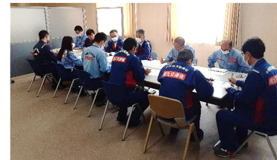
北陸地整にて内業【先遣班】