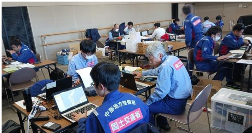
小矢部市内にて内業【道路班】