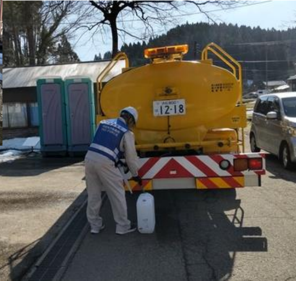
輪島市内にて給水支援【給水支援班】