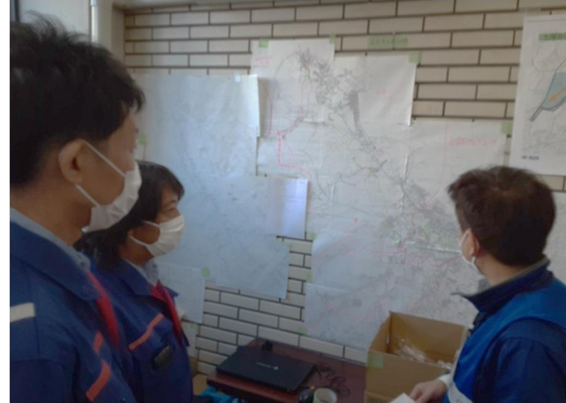
名古屋市上下水道局との打ち合わせ【水道班】