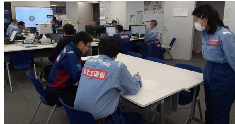
北陸地整にて内業【先遣班】