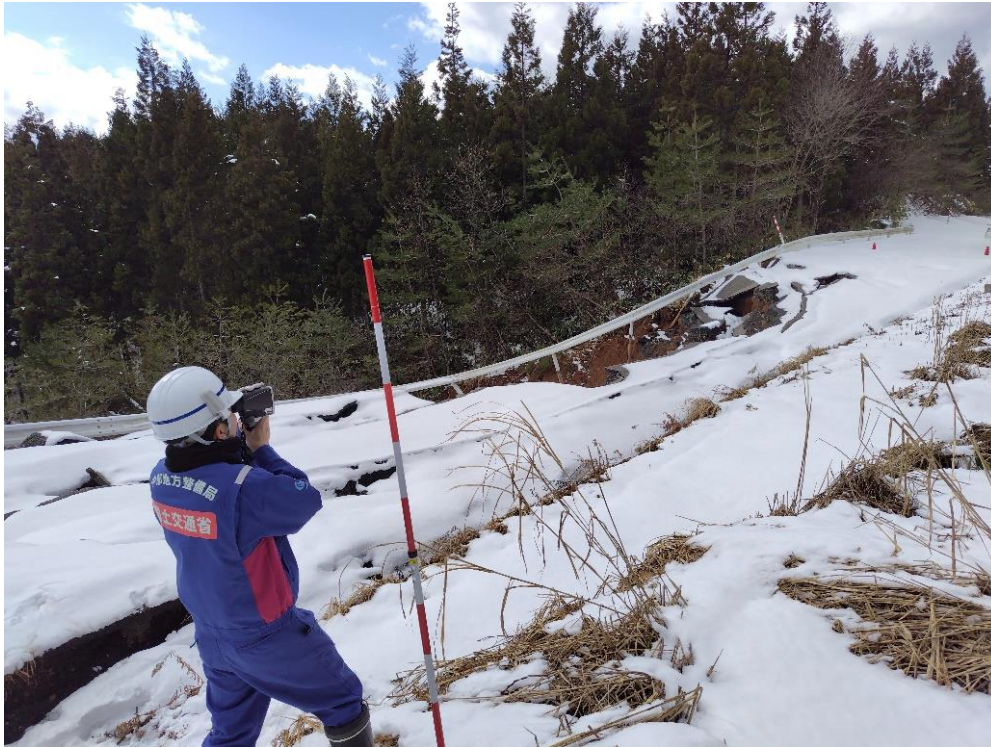
能登町内にて現地調査【道路班】