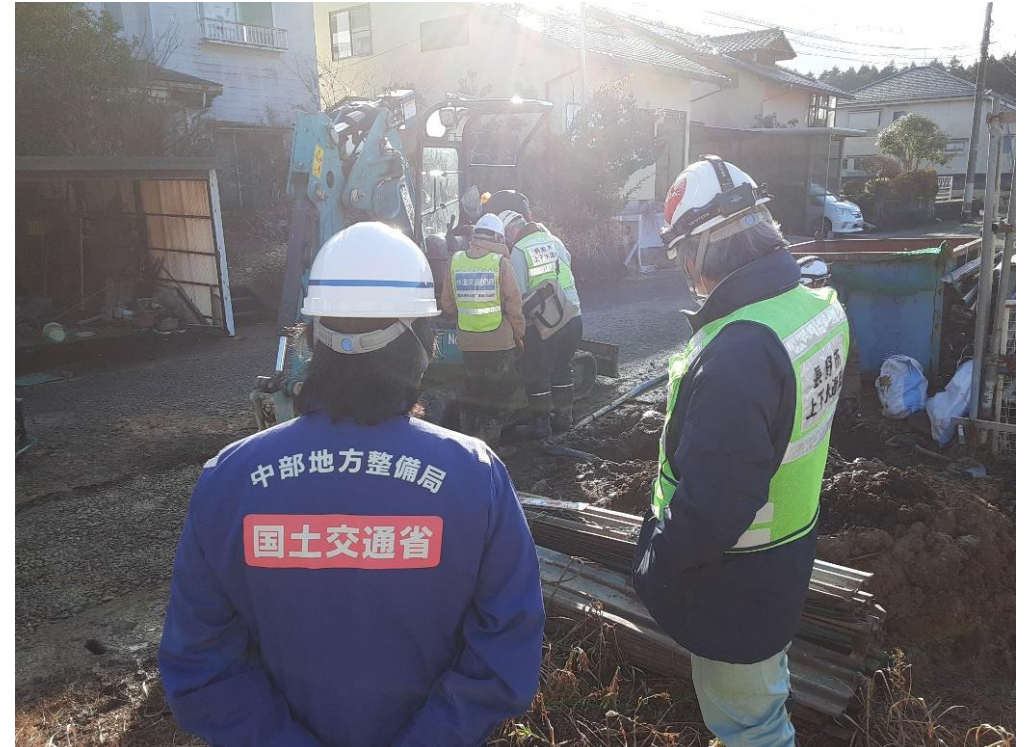
七尾市内にて現地調査【水道班】