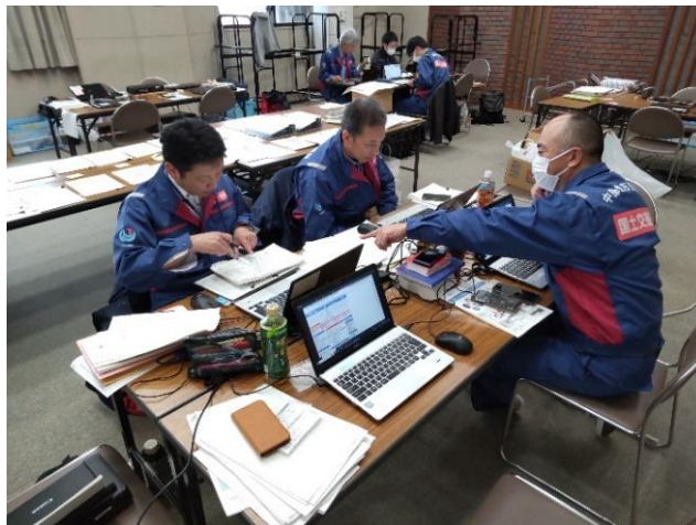
小矢部市内にて内業【道路班】