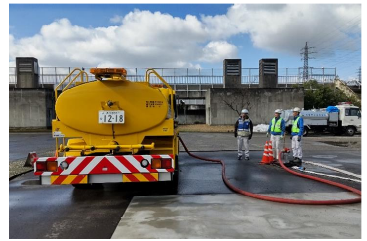
金沢市内にて補水【給水支援班】