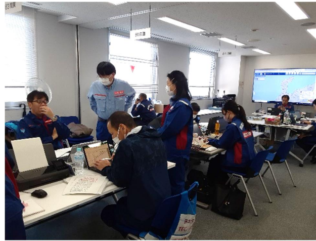
北陸地整にて内業【先遣班】