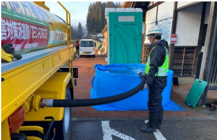
輪島市内にて補水【給水支援班】