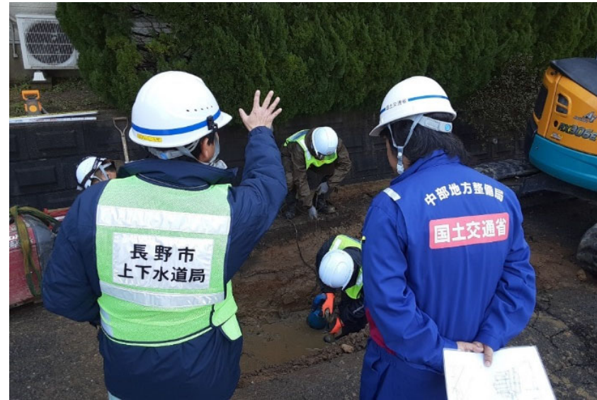
七尾市内にて現地調査【水道班】