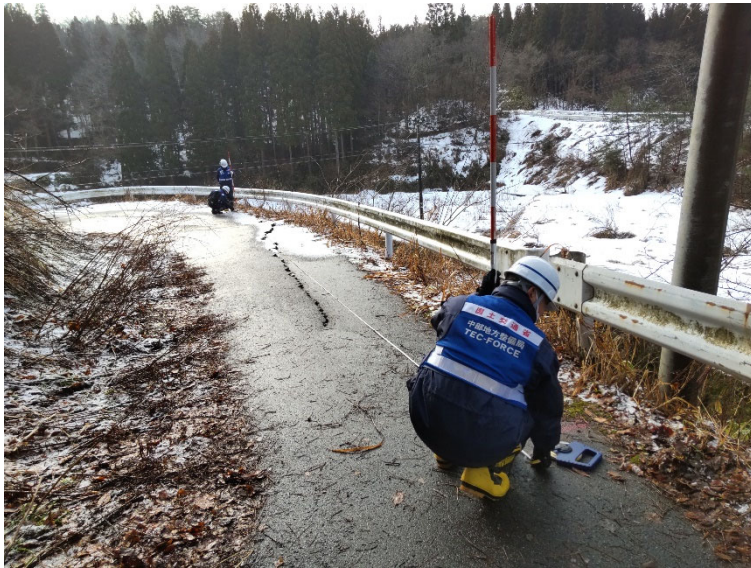
能登町内にて現地調査【道路班】