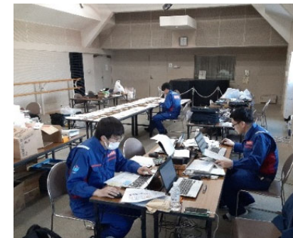
小矢部市内にて内業【道路班】