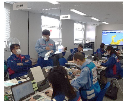
北陸地整にて内業【先遣班】