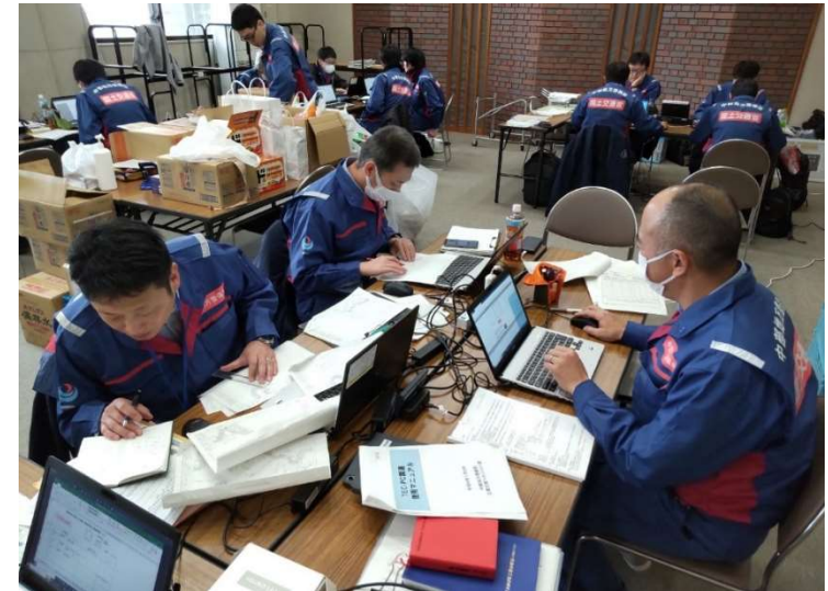
小矢部市内にて内業【道路班】