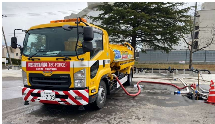
金沢市城北水質管理センターにて補水【給水支援班】