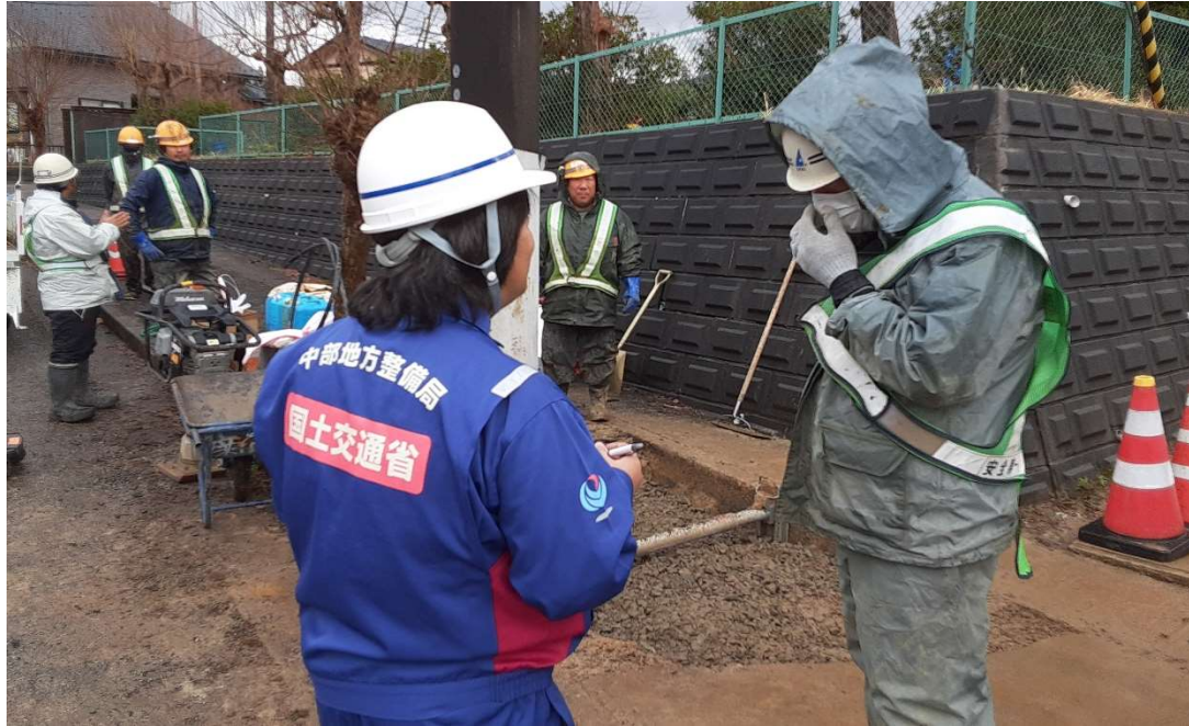
七尾市内にて現地調査【水道班】