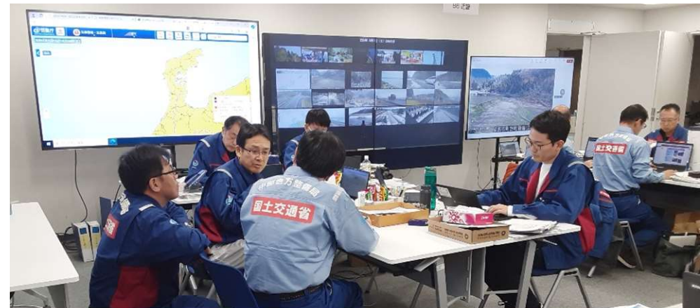
北陸地整にて内業【先遣班】