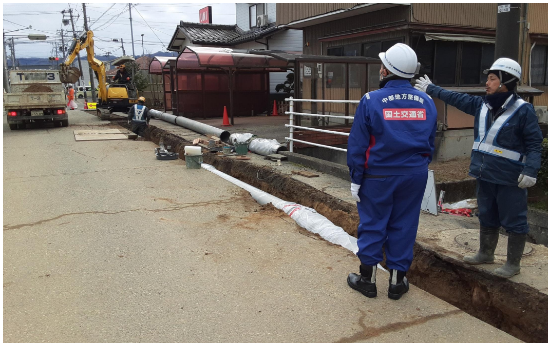
七尾市内の復旧工事確認【水道支援班】