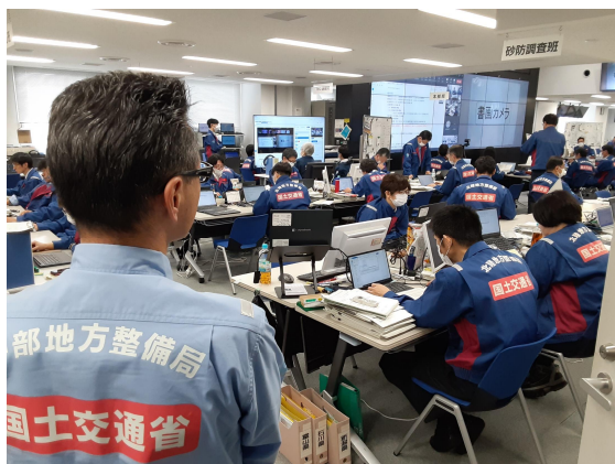
北陸地整にて内業【先遣班】