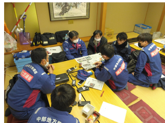
クロスランドおやべにて内業【道路班】