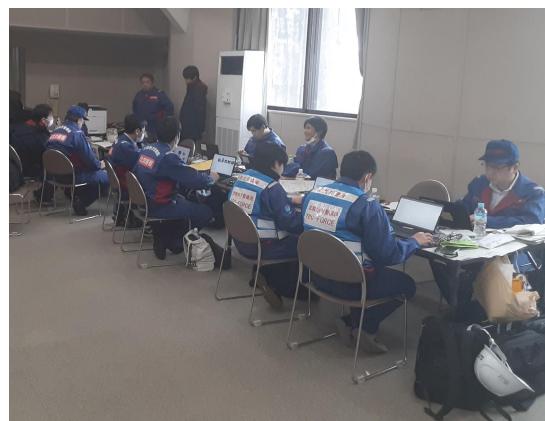
クロスランドおやべにて内業【河川班】