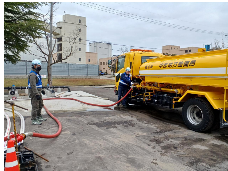
金沢浄水場にて補給【給水支援班】