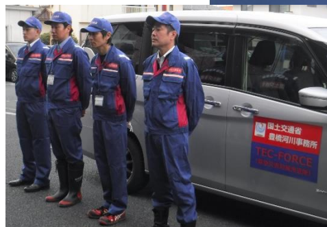
被災状況調査班：河川班 派遣

期間：1月8日（月）～ 第4陣派遣中 職員：実人数2人（延べ52人・日） 班構成：本局 活動内容：上下水道調査