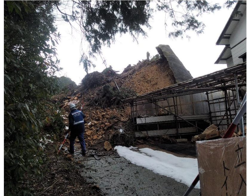
輪島市にて被災状況調査【砂防班】