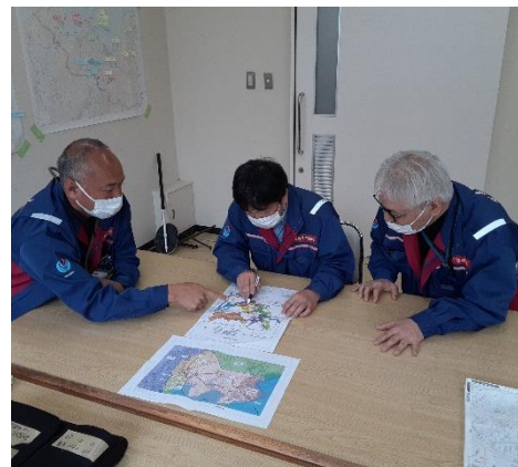
七尾市役所にて内業【水道支援班】