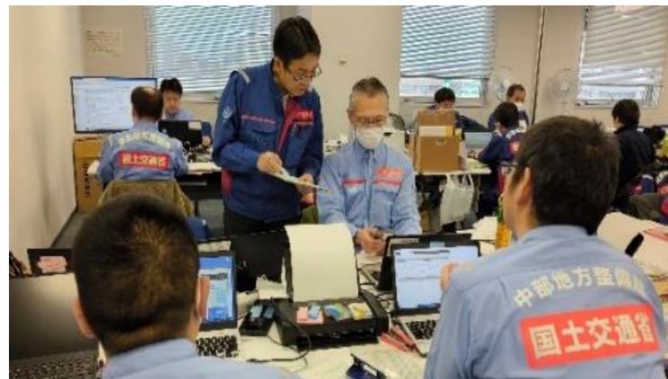
北陸地整にて内業【先遣班】