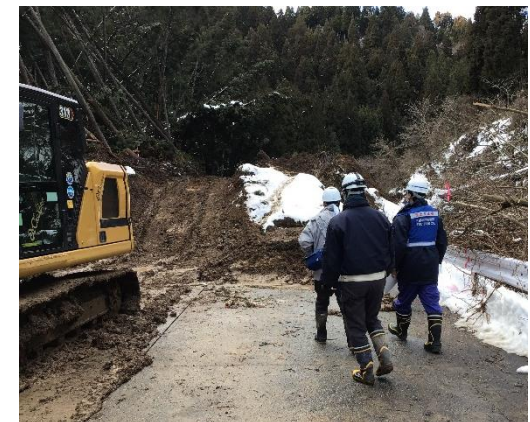
道路啓開現場にて現地確認【道路啓開班】