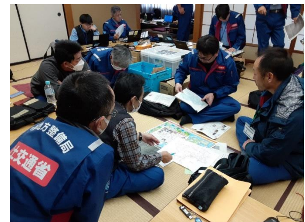
富山県小矢部市内にて打合せ【道路班】