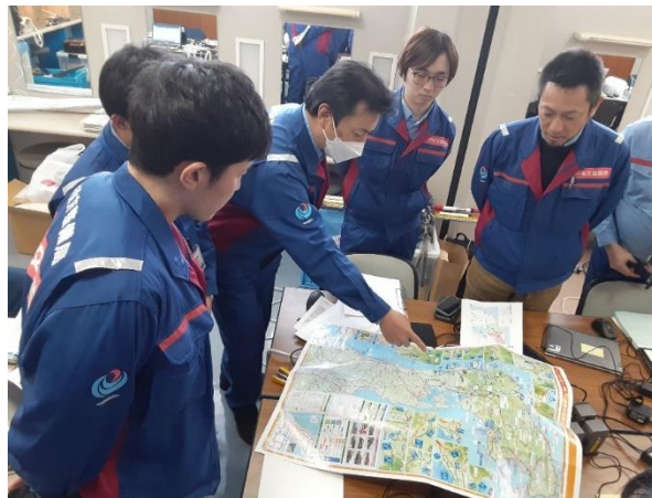
富山県小矢部市内にて打合せ【砂防班】