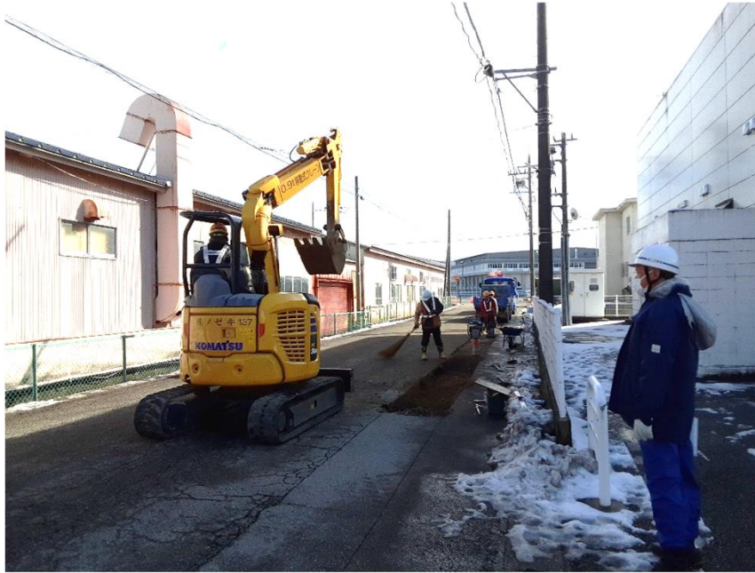
応急復旧工事の立会【水道支援班】