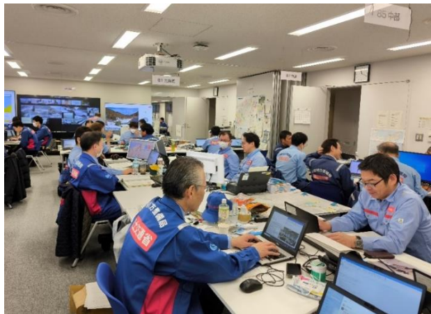
北陸地整にて内業【先遣班】