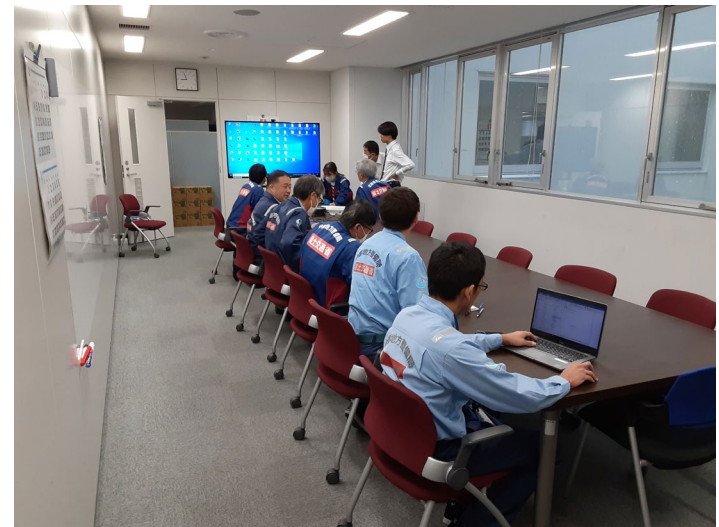
北陸地整にて内業【先遣班】