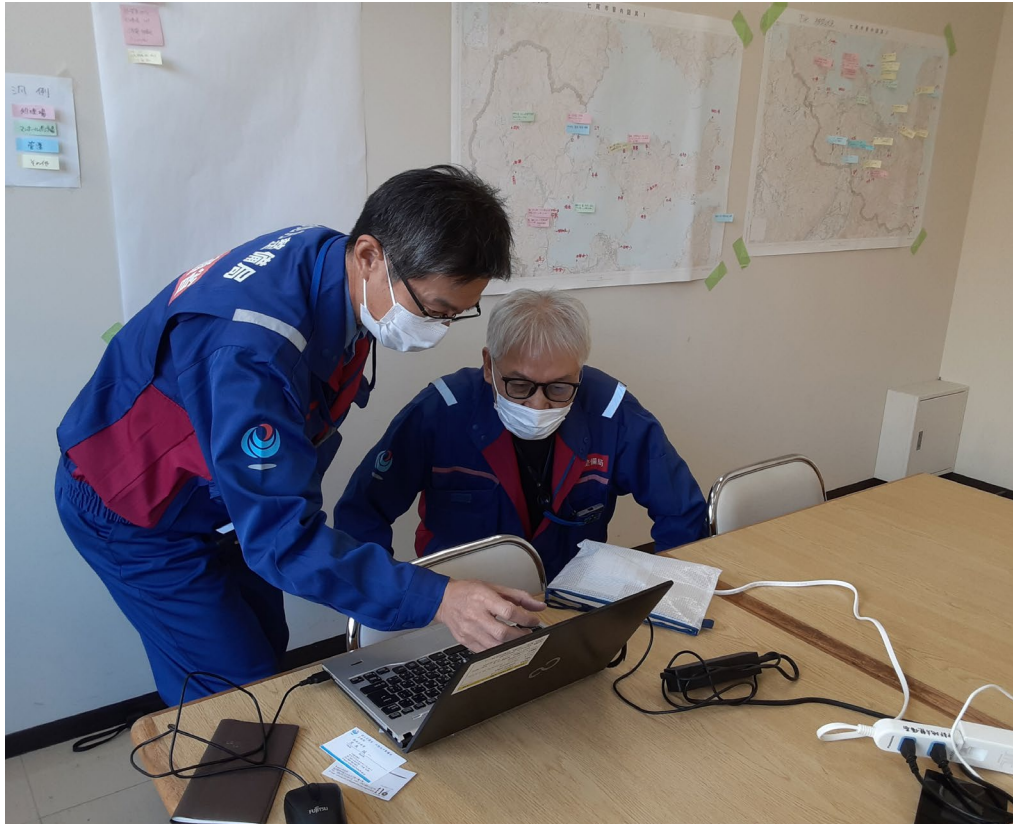
七尾市役所にて内業【水道支援班】