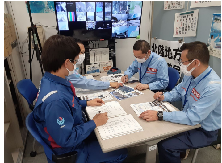
北陸地整にて災害対応支援【情報通信班】