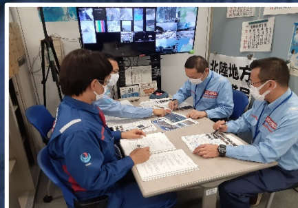
情報通信班(北陸情通支援) 北陸地方整備局