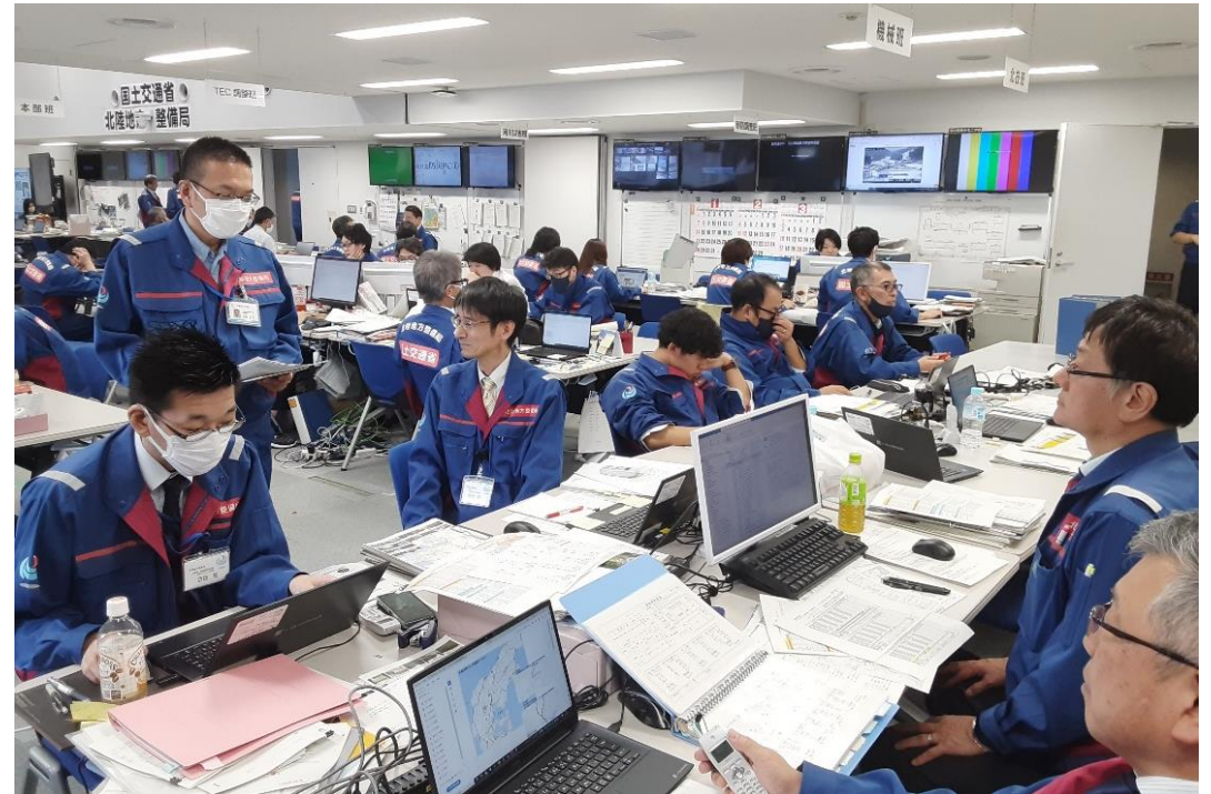
北陸地整にて災害対応支援【情報通信班】