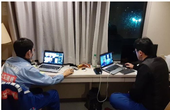
金沢市内にて内業【市町道調査班】