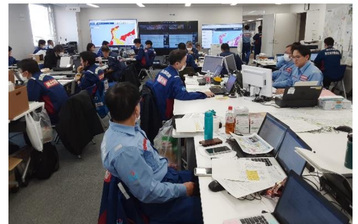
北陸地整にて内業【先遣班】