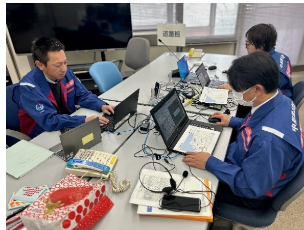
中部地整管内にて被災状況調査内業【砂防班】