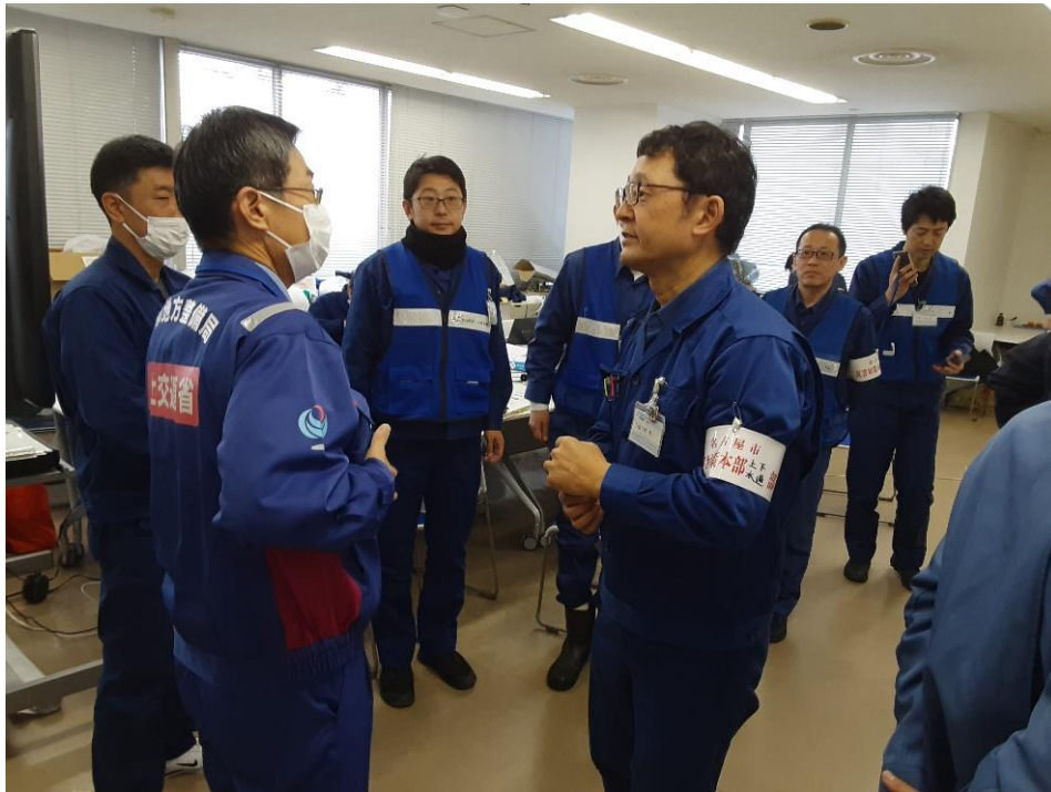
金沢市企業局にて打ち合わせ【水道支援班】