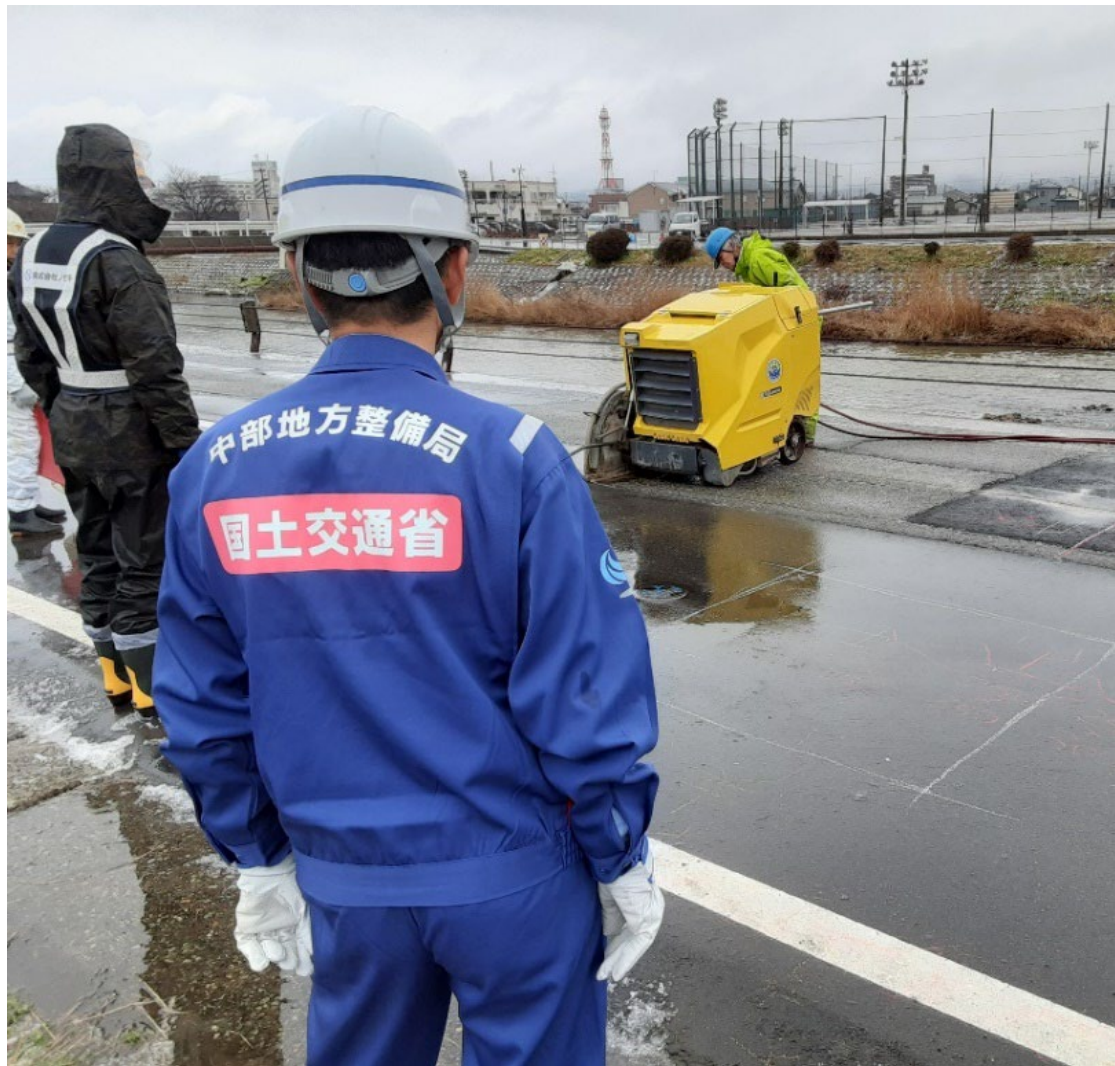
七尾市にて被災状況調査【水道支援班】