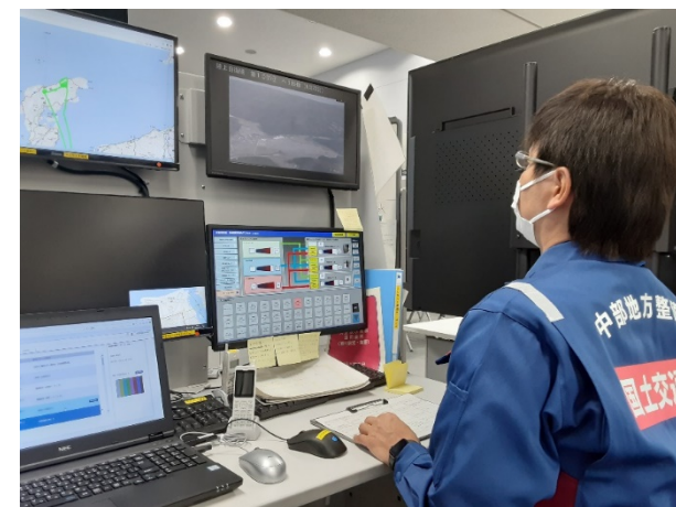
北陸地整にて災害対応支援【情報通信班】