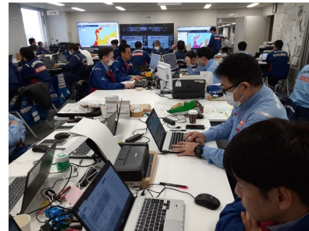
北陸地整本局にて内業【先遣班】