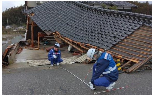
珠洲市にて被災状況調査【道路班】