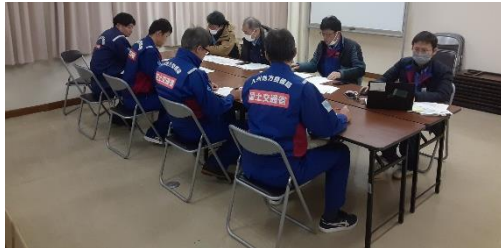
富山県小矢部市にて内業【市町道調査班】