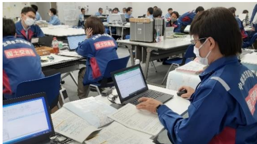
北陸地整にて情通支援【情報通信班】