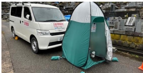
輪島市内にトイレ支援車を配備【応急対策班】