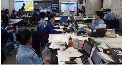
北陸地整本局にて内業【先遣班】