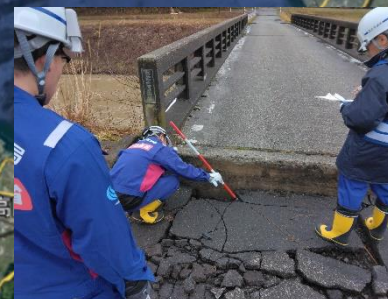
被災状況調査班 道路班 珠州市における現地調査