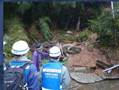
被災状況調査班 砂防班 輪島市における現地調査