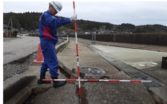
七尾市にて被災状況調査【水道支援班】