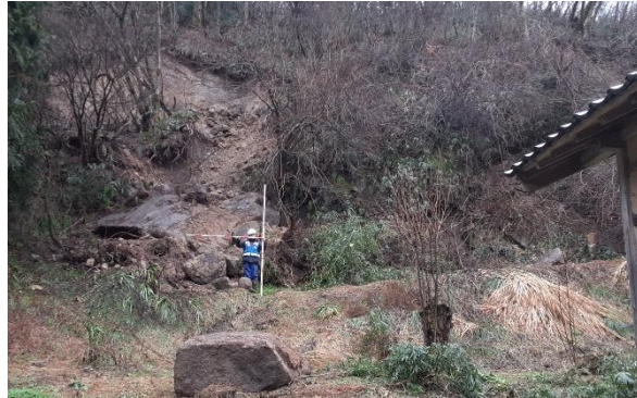
輪島市にて被災状況調査【砂防班】