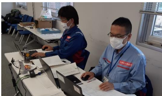
北陸地整にて情通支援【情報通信班】