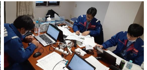
調査結果のとりまとめ【道路班】