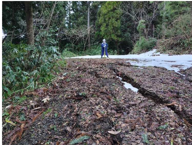
輪島市内被災状況調査【砂防班】