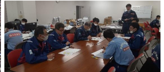
調査箇所打ち合わせ【市町道調査班】