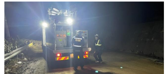
輪島市内における照明支援【照明支援班】