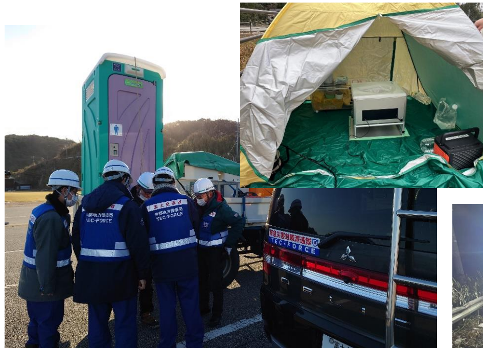
輪島市内におけるトイレ支援【トイレ支援車班】