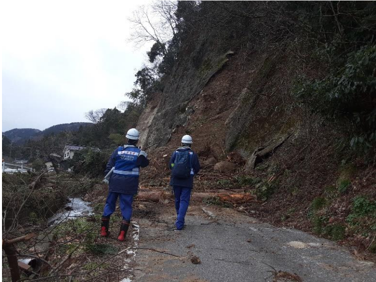
輪島市内被災状況調査【砂防班】