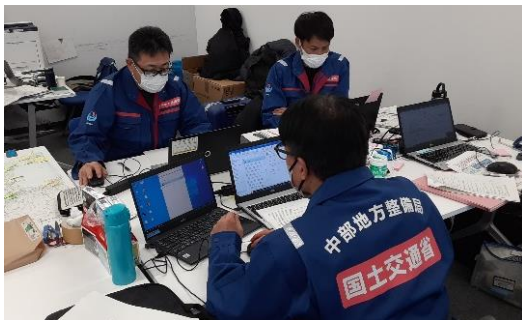
第3陣との引き継ぎ後資料確認【先遣班】