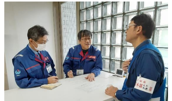
名古屋市との打合せ【水道支援班】