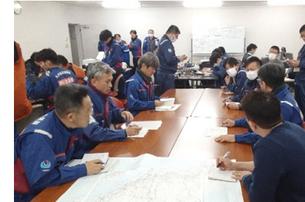
他地整との会議【市町道調査班】