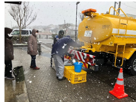
水見市における給水支援活動【給水支援班】