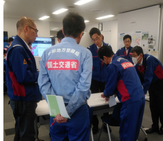
他地整との会議【先遣調査班】