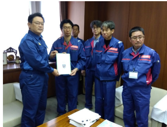
七尾市役所における手交式【道路班】