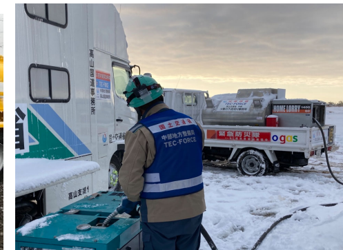
能登空港におけるローリーによる待機支援車への燃料補給【応急対策班】