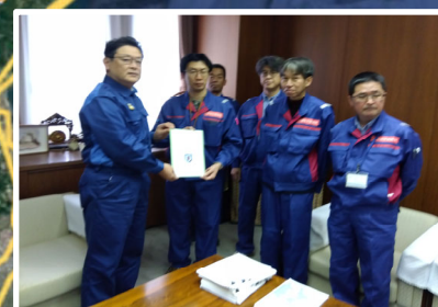
被災状況調査班 道路班 七尾市役所にて手交式