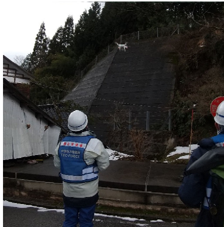
輪島市におけるドローンを用いた被害状況調査【砂防班】