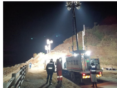
輪島市における照明車支援【照明支援班】