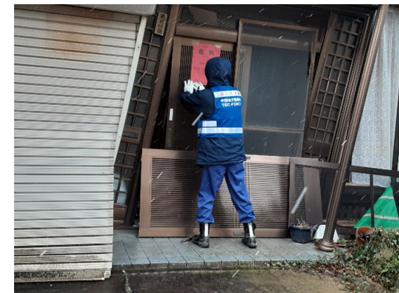
能登町における危険度判定調査【建築班】