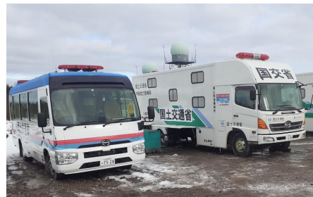
能登空港に待機支援車を配備【応急対策班】