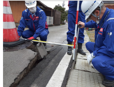
七尾市における被害状況調査【道路班】